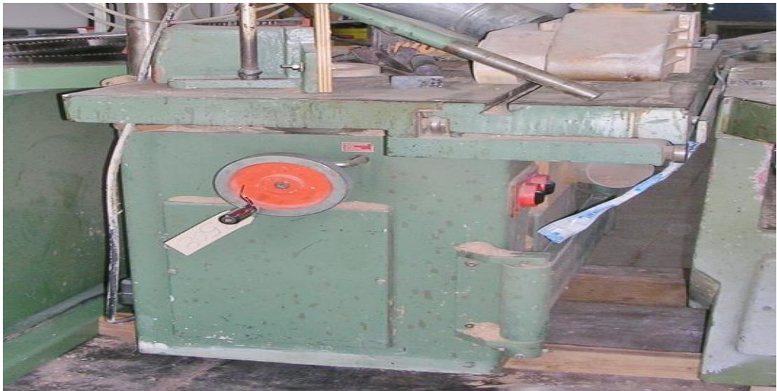
Photos prise à des machines de la menuiserie du bois.