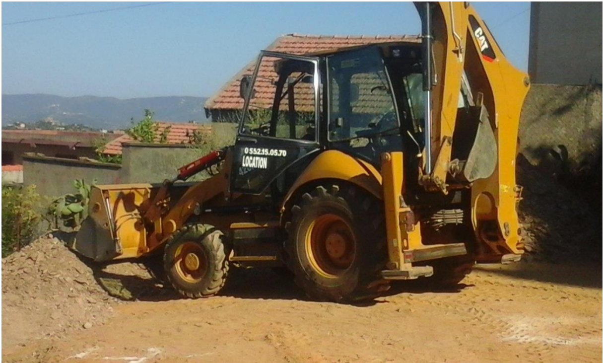
Photo prise pour l'engin de location