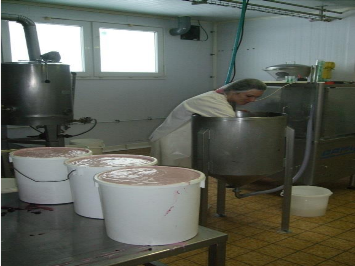
Une photo prise dans la laiterie fromagerie