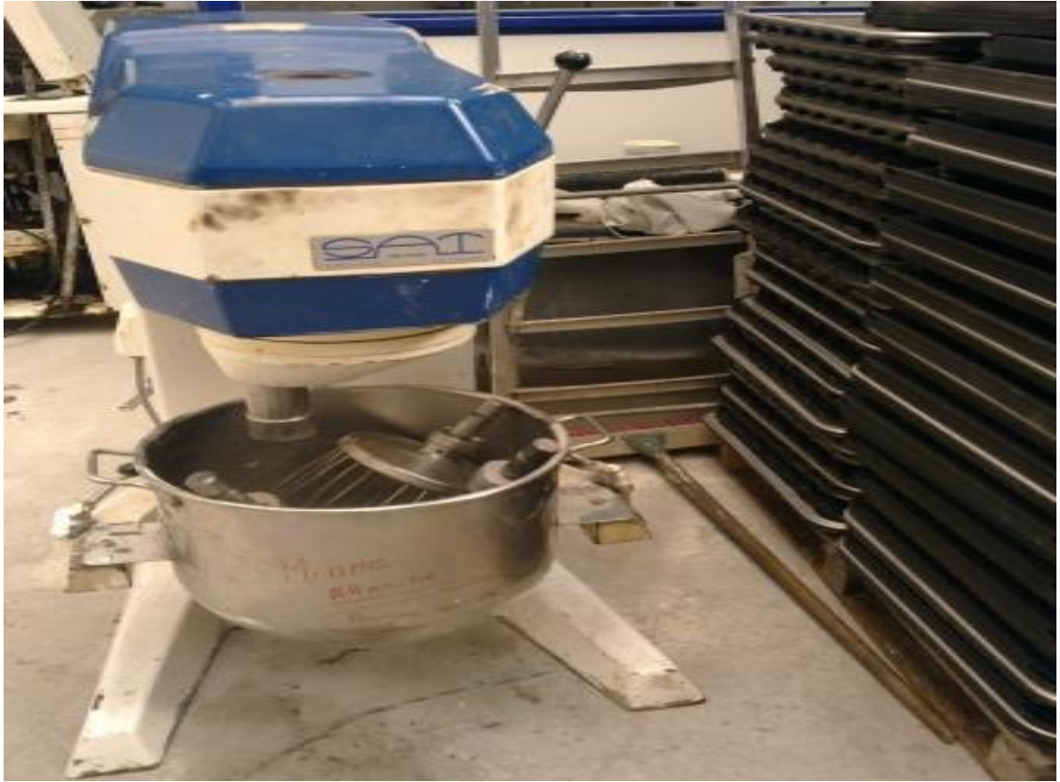
Photo prise pour un batteur pâtissier