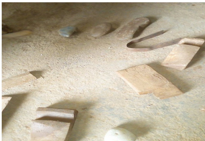
Figure 3 : Les outils de fabrication traditionnelle « Issekam »