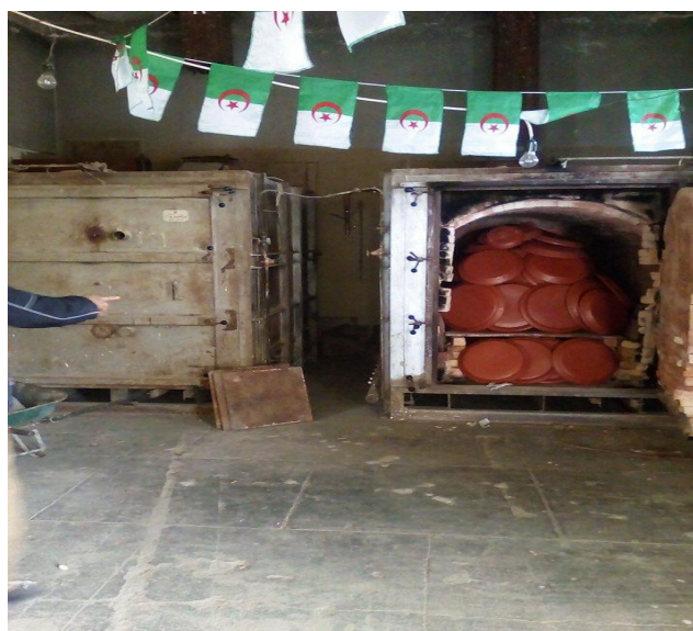
Figure 4 : La cuisson moderne

Pour ce qui est de la cuisson moderne, le potier place ses objets dans un four électrique à deux reprises, la première fois la température doit être réglée à 820° une fois l'objet cuit, le potier le décore en signes berbères en utilisant de la peinture (oxyde blanc et noir importé) gris et parfois rouge, en suite l'objet sera de nouveau retourné au four à une température élevée à 840°, une heure après, on obtient un objet fini près à l'usage et à être commercialisé.