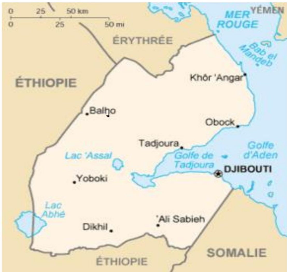
Carte de Djibouti