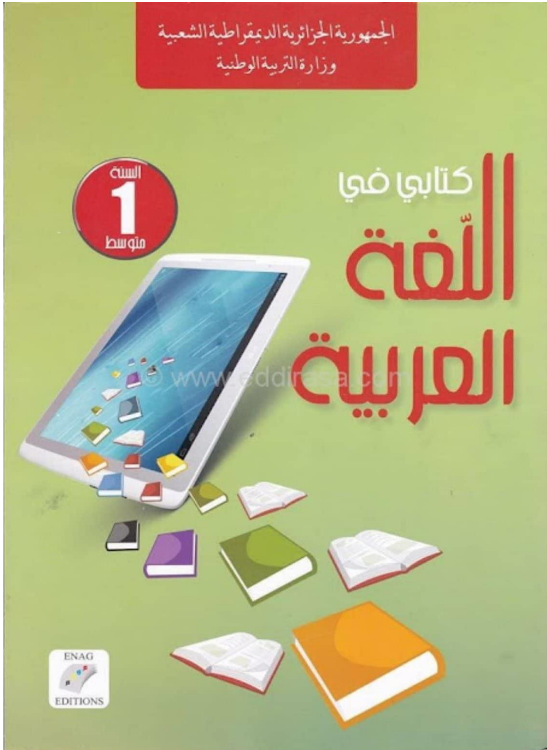
صورة لغلاف كتاب السنة الأولى متوسط