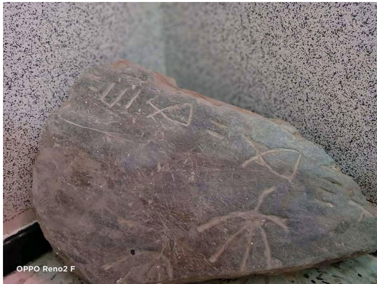
Figure9 : la stèle ( photo originale)

Le village Takhlidjt comme tous les villages kabyles , est habitée par des berbères depuis des millénaires, une stèle a été trouvée au village en 2005 par un groupe de jeunes lors des opérations de nettoyage , elle prend la forme d'une amende ou d'une feuille d'arbre , mutilée, elle est d'une hauteur de presque 1 mètre et largeur d'environ 50 cm , avec des écritures qui restent à sens flou , : d'après Hamid At Amara : « di 2005 nni , nxeddem ticemlilt , nessekfal , almi nufa yiwen uzru , yekteb sufella , yesæa des symboles , ad yesæu azal n lmitra di teyzi , iyil di tehri , imusnawen ur fhimnar-a d acu d-yuran fell-as »