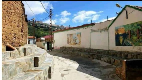
Figure 7: tajmaet n barra (photo originale)