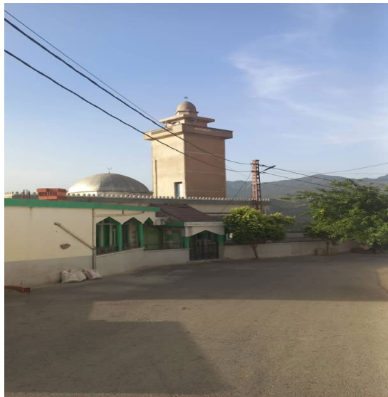
Figure3 : Ljameε ajdid ( photo originale)

« yella yiwen n lğameε di tejmaet yeqlaq ačalaya , yeqqimed kan da souvenir , ma d wahin usawen , melmi kan i t-nebna , tjemεed akk taddart idrimen , argaz tameτtut , yal yiwen s wacu izmer ad iεawen , almi yekfa lebni-ines , dihin i d-nettberriħ ticki ara yemmet yiwen , ney nebya ad d-nessiwel yer tyuzi , dayen nettberriħ-d i unejmaε ney i tcemlilt , ma d la siréne ina nettsoni deg-s tlata tikkal mi ara yili danger deg taddart. »