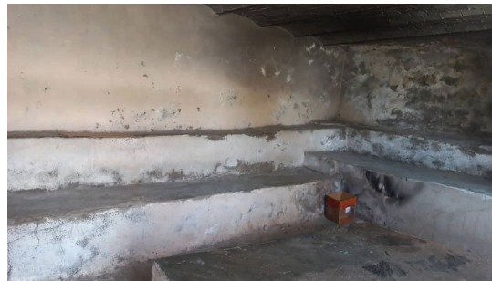
Figure 8: tajmaet n daxel ( photo originale )