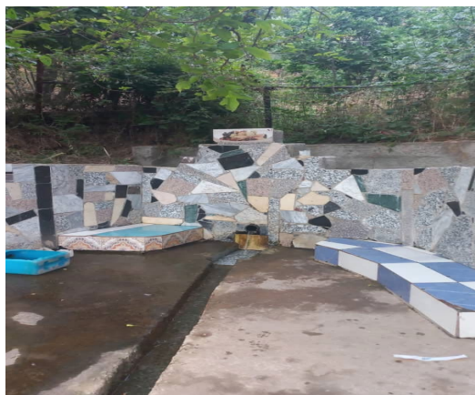
Figure5 : tigerwin (photo originale )

D'après ahmed ay dawed « taddart nney tesa mlih aman , nesa tala , taewint , amejrar , tala n ssuq , tala n tyazit , tigerwin ufella , tigerwin bbada, leinsar n eziza , ak d tegzirt maena tellement beeden haca ylata i mazal ssexdamen medden ».