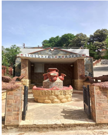
Figure6 : tala n taxlijt (photo originale)