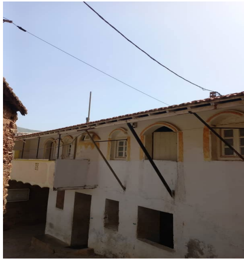
Figure 4: Ljameε aqdim( photo originale)