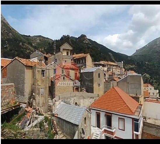
Figure 7 Leħara ufella