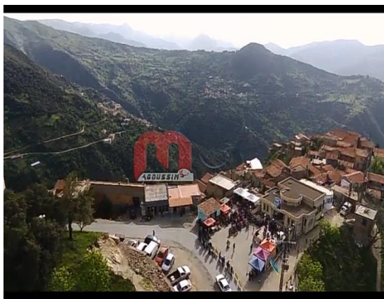
Figure 10 La plateforme du village