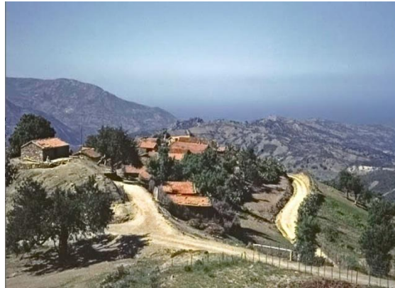
Figure 6 Ighil Yazouzen au nord-ouest de Ait Chafaa