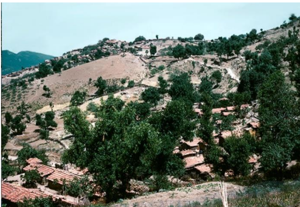
Figure 4 Ait Chafaa - vue générale