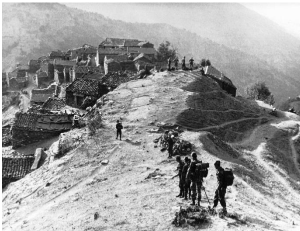
Figure 1 Abourghes pendant la guerre