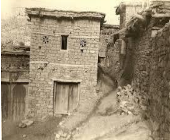
Figure 2 la maison at wejeud pendant la guerre