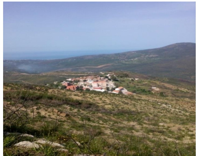
Figure 11 Ait Chafaa- vue générale prise le 27/07/2018