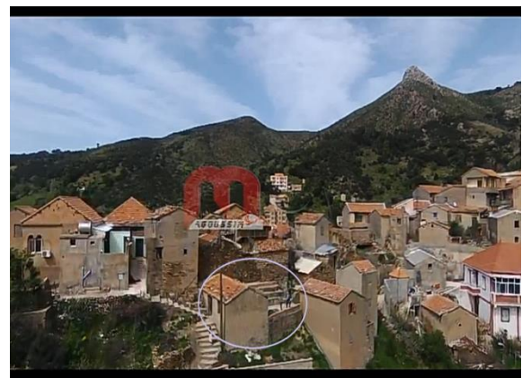
Figure 9 tajmaet du village encerclé

Elles sauvegardent, protègent, enrichissent et mettent en valeur le patrimoine dans son infinie diversité et compte tenu de toutes ses composantes ; ils encouragent les initiatives culturelles locales, développer les liens entre les politiques culturelles de l'État et celles des