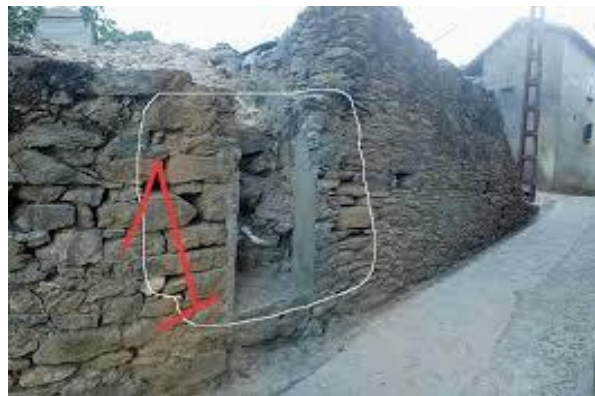
Figure 3 Photo du vieux commerce du village