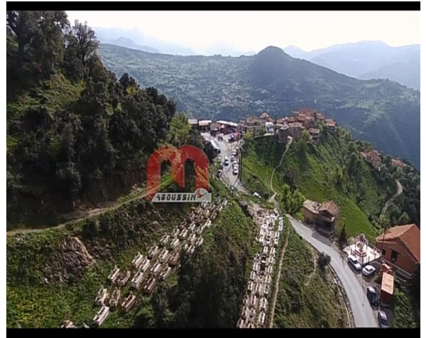
Figure 8 Cimetière du village Abourghes