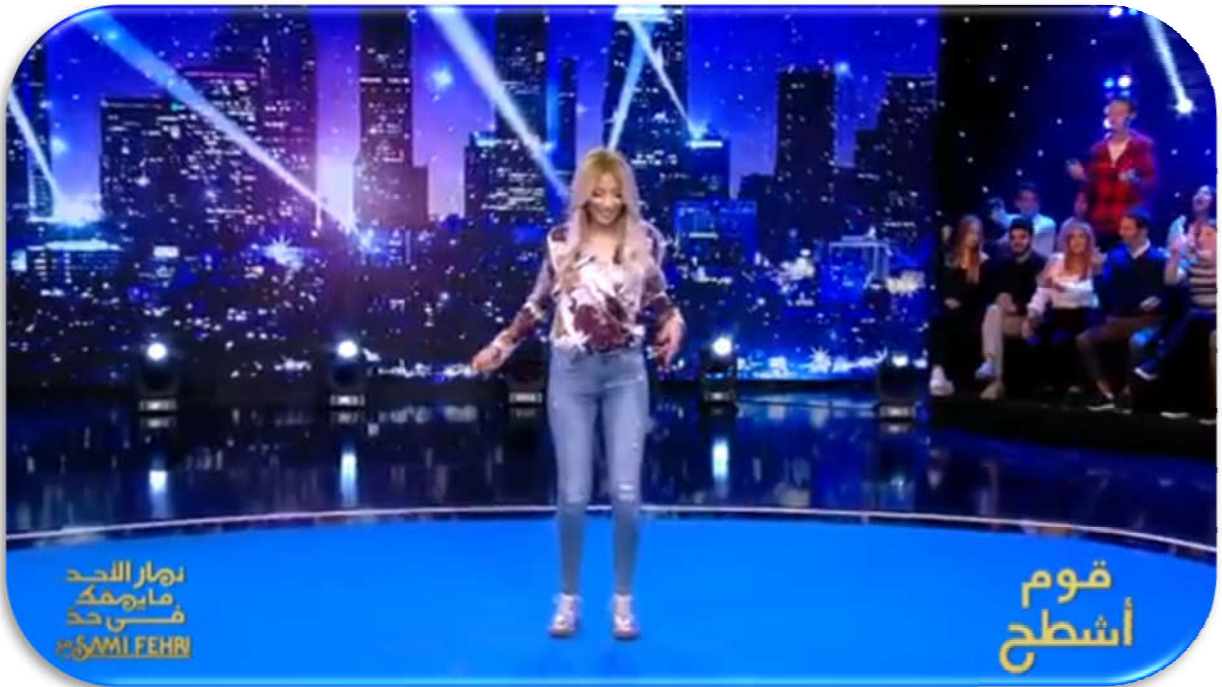
- صور مستخرجة من برنامج نهار الأحد ما يهكم حد التونسي -

" النسخة التونسية من برنامج Vendredi ماشي عادي "