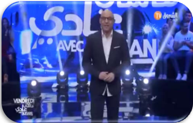
فوتوغرامات من المقطع