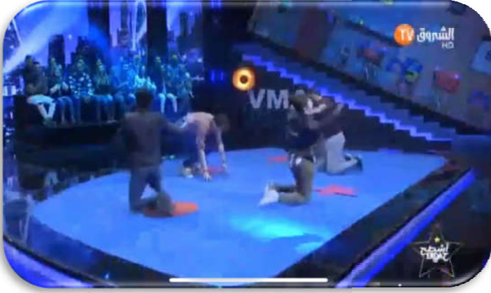
فوتوغرام من المقطع

مايكل جاكسون Billie Jean تظهرهم الصورة وهم يتمايلون ويرقصون ببهلوانية محاولين تقليد رقصه البوب في صورة توحى بالاستهانة و الاستهزاء بالآخرين ومحتوى البرنامج السطحي التافه المروج للرقص والغناء .