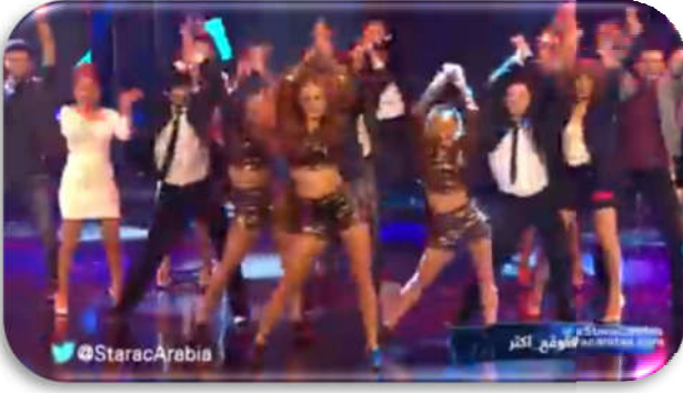
فوتوغرام من المقطع

ليظهر في الأخير الرقصات بلقطة متوسطة بلباسهن الشبه عاري وهن يؤديين حركات سريعة بالرجل مع هز كل الجسم في مشهد يعبر عن طابع الرقص المختلط لينتهي المشهد بفتح الجميع لأرجلهم ورفع الأيدي إلى الأعلى كنوع من التحية الختامية للعرض متبينين بذلك هذا النوع من الرقص الغربي المروج للتعري والتحرر الزائد عن اللزوم وإسقاطيه على الثقافة العربية.