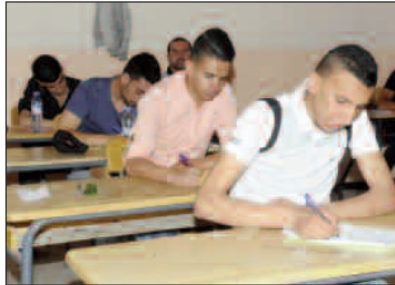
Les candidats contraint à repasser les matières touchées par la fuite.

Lors de leur réunion, jeudi soir avec le ministre de l'Éducation, les syndicats autonomes étaient unanimes à proposer de faire repasser aux candidats les matières touchées par la fuite. Ceci, argumentent-ils, dans le souci de garantir la crédibilité du bac et l'égalité des chances entre tous les candidats. Les syndicats estiment que cette proposition a de fortes chances