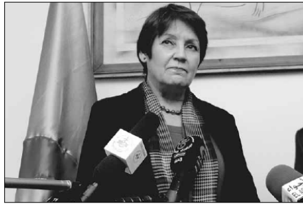
La ministre de l'Éducation, Mme Nouria Benghabrit.

La ministre de l'Éducation nationale, M me Nouria Benghabrit, n'en finit toujours pas avec les tracasseries dans son secteur. Depuis sa nomination à la tête de ce département ravagé par des années de régression, la ministre, animée par une volonté de redonner à l'école algérienne ses lettres de noblesse, essuie des attaques de toutes parts et pas des moindres. Après avoir "calmé" les syndicats à travers la charte dite de stabilisation, elle a été victime, elle l'est toujours, d'une levée de boucliers orchestrée par les tenants de l'islamisme et les adeptes du fondamentalisme. Menées principalement par l'Association des Oulémas et le MSP, les attaques à répétition contre la ministre ont parfois frôlé le stade de la misogynie, de l'insulte et de l'invective. Si