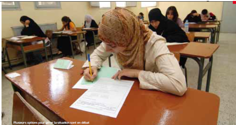
Plusieurs options pour gérer la situation sont en débat

21h20. Le communiqué du ministère de l'Éducation nationale tombe : « La fraude, sur intervention externe aux classes d'examen, par diffusion des sujets de la filière sciences expérimentales, au nombre de 7, appelle des décisions fermes à l'égard des auteurs de cette démarche dans le sens largement partagé par la communauté éducative en matière de préservation de la crédibilité du bac et des principes de mérite, d'équité et d'égalité des chances entre tous les candidats. » Autrement dit, la décision du ministère de l'Éducation nationale sur le devenir du bac 2016 n'est toujours pas tranchée. C'est le gouvernement qui doit le faire. Au moment où nous mettons sous presse, les représentants des syndicats et de l'Association des parents d'élèves n'ont toujours pas terminé leur débat. La ministre et deux de ses inspecteurs généraux, qui ont reçu les partenaires sociaux, étudiaient encore « dans le détail ce qui doit être proposé au gouvernement », affirme Meziane Meriane du Snapest. Les propositions à remettre au gouvernement pour aval respectent deux principes : l'égalité des chances et la crédibilité de l'examen. C'est-à-dire trancher entre « revoir entièrement l'examen en annulant la session de mai 2016 ; revoir les épreuves concernées par la fuite des