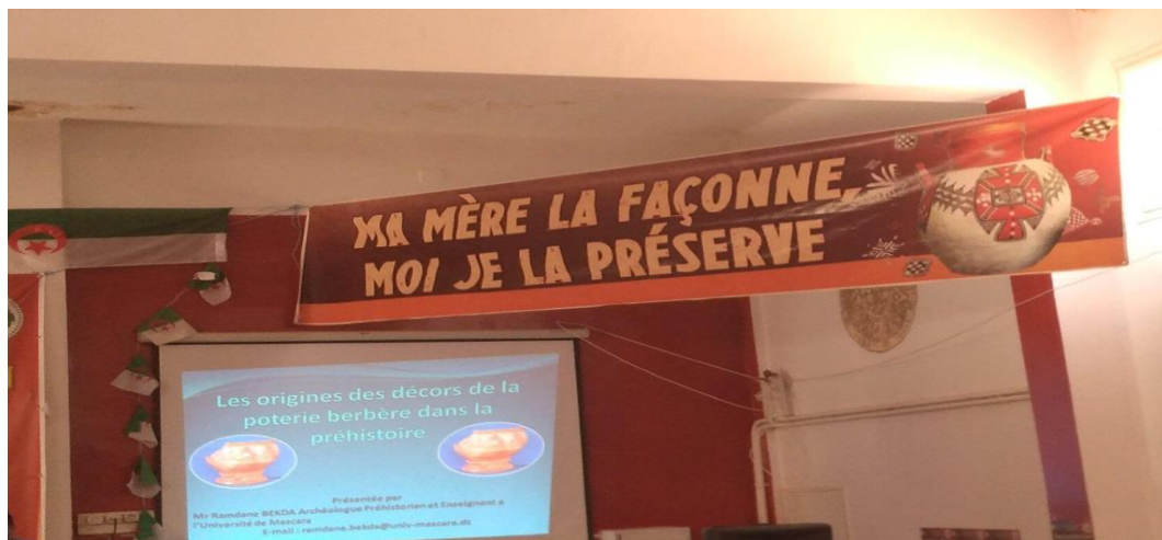
Figure n°01 : la première édition du festival

Ce festival a commencé de 21 au 25 juillet 2022, ce festival nous a beaucoup aidé dans notre recherche sur les potières. Cette manifestation qui permet à la région de sortir de sa torpeur regroupe des artisans de différentes localités de Tizi Ouzou. Elle permettra aux potières d'écouler leurs produits, tout comme les autres produits de l'artisanat. Organisée sous le haut patronage du ministre de la culture, cette fête a vécu la participation d'une quinzaine d'artisans qui ont exposé leurs différents produits.