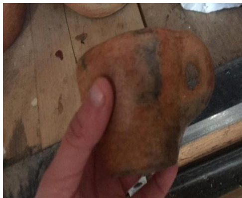
Figure N°14: Verre en poterie (aqeluc)

Fait d'argile est un type d'ustensile de forme qui est principalement utilisé à des fins de servis alimentaire et les assiettes peuvent être de dimension et de tailles différente selon le but de leur utilisation.