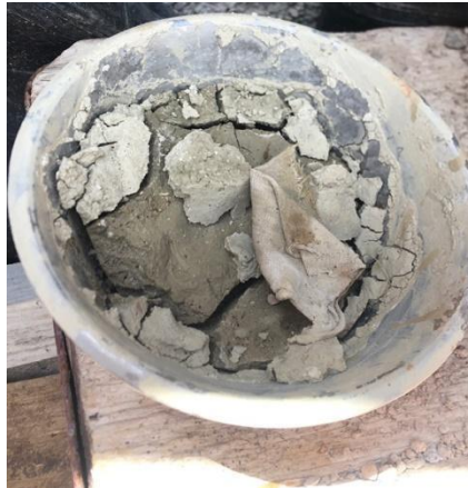
Figure N°25 : L'argile a foulon (Senşal)

Est une argile fine et malléable, prisée pour sa plasticité et utilisée dans la poterie traditionnelle. Elle permet de façonner des objets utilitaires et décoratifs solides après cuisson, comme des jarres et des plats. Préparée avec soin, elle est aussi liée à des pratiques culturelles en Kabylie, où elle sert à produire des poteries locales alliant utilité et esthétique.