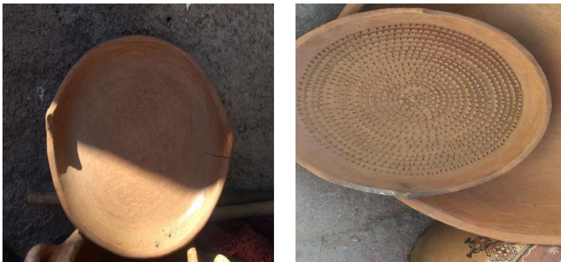
Figure N°11 : Les plates cuissons à pain (affarah)

préparation et le partage sont au souvent des réunions familiales, faisant de ce plat un élément essentiel du patrimoine culinaire régional.