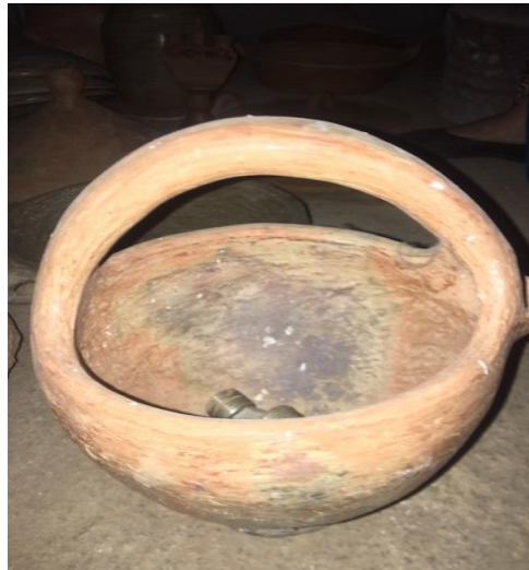
Figure N°15 : Pot a bouillon (abuseqqi)