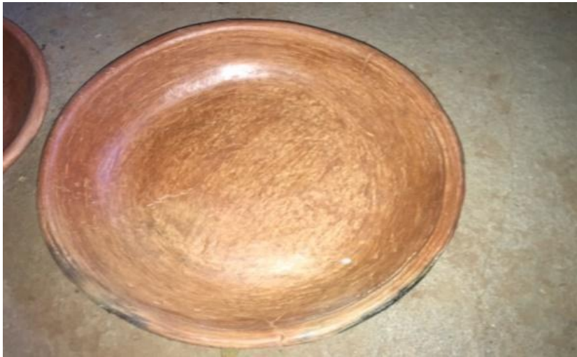
Figure N°22 : Le grand plat (lgefna)

Le grand plat en poterie est un vaste récipient fabriqué en terre cuite, utilisé principalement pour rouler le couscous, le pain et aussi pour servir ou préparer de grandes quantités de nourriture. Ces plats sont connus pour leur durabilité, leur résistance à la chaleur et leur capacité à conserver la chaleur des aliments.