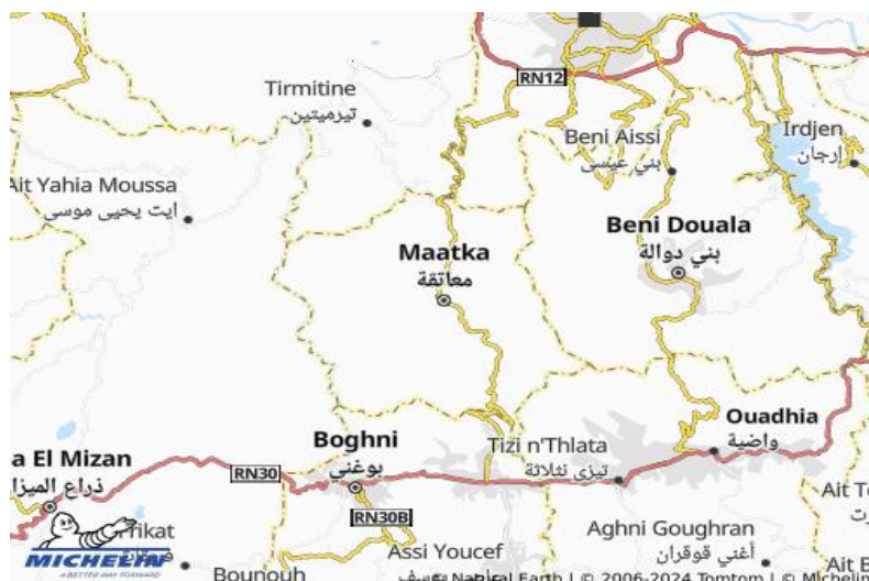
Figure n° 01: Carte géographique de Maâtkas et ses environs (bas de page archives)