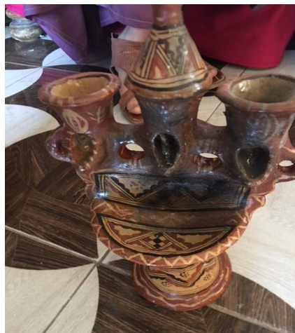
Figure N°18 : Lampe à huile (Imesbah)

La lampe à huile accompagne donc souvent cette étape importante, en apportant une dimension symbolique forte à la cérémonie de mariage