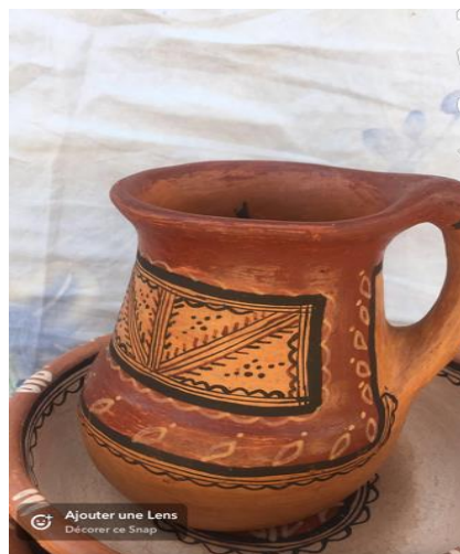
Figure N°12 : Pot à anse (abetac)