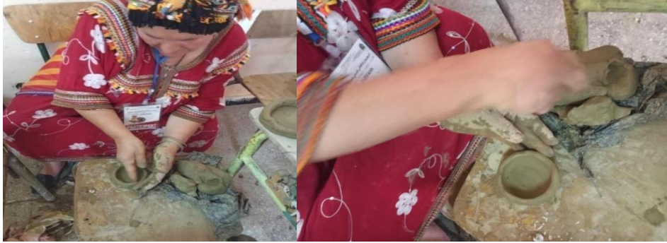
Figure n°3 :sekoura.S

Sekoura n Ahmed Amran est un exemple de résilience et de dévouement. Orpheline élevée par ses oncles, elle a surmonté les épreuves de la vie coloniale et les dangers liés aux activités de résistance de sa famille. Trouvant dans la poterie une source de stabilité et de créativité, elle a transformé cet art en un pilier de sa vie quotidienne.