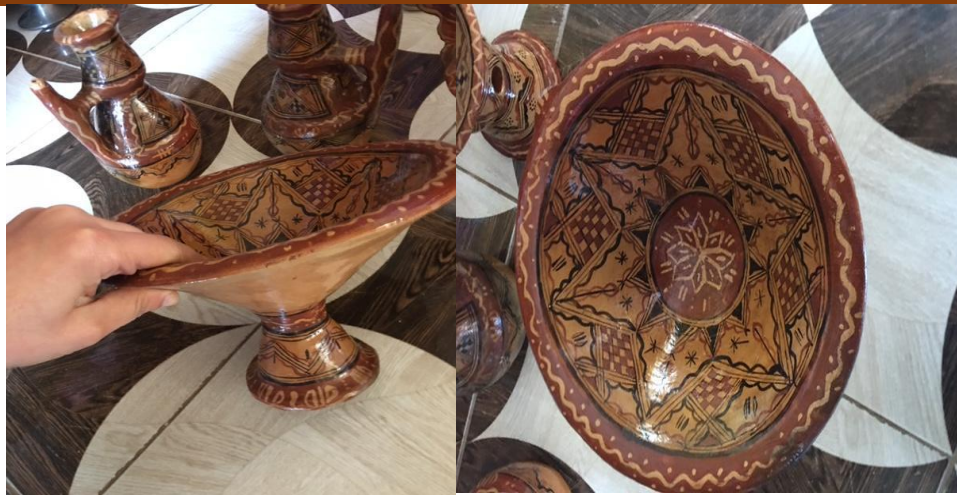
Figure N°17 : Le plat de henné (ilmetred)