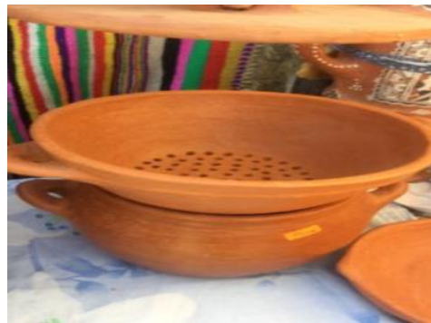
Figure N°10 : Couscoussier (Tuggict ,taseksut)