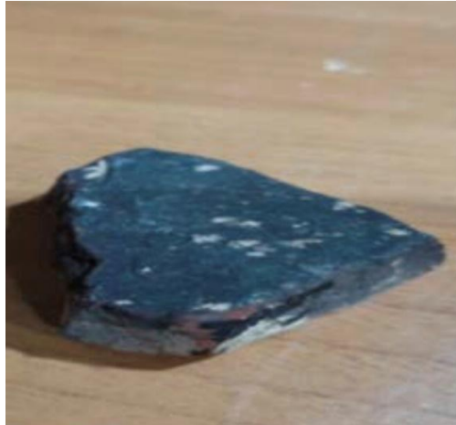
Figure N°27: L'oxyde de manganèse (usbu)

L'oxyde de manganèse souvent désigné par "usbu" dans le contexte de la poterie, est un minéral utilisé comme colorant. En poterie, il est ajouté à l'argile pour créer des teintes allant du brun au noir. Ce matériau joue un rôle essentiel dans l'esthétique des objets en argile, contribuant à des effets de couleur et à des textures variées lors de la cuisson.