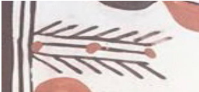
Figure N°32 : Le Blé (irden)

En décorant les poteries avec ce motif, les potiers expriment également la gratitude envers la terre et ses bienfaits. Ces objets, utilisés au quotidien, sont ainsi imprégnés d'une symbolique qui va au-delà de leur simple fonction utilitaire : ils deviennent des objets de contemplation, rappelant aux utilisateurs la richesse de la nature et l'importance de la connexion avec celle-ci.