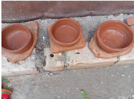
Figure N°08 : Séchage

B- Retouche : Une fois partiellement séchés, les objets peuvent être retouchés et affinés, en enlevant les aspérités et en lissant les surfaces.