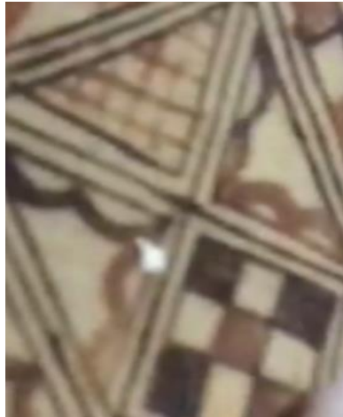
Figure N°28 : Les ciseaux (timqestin)