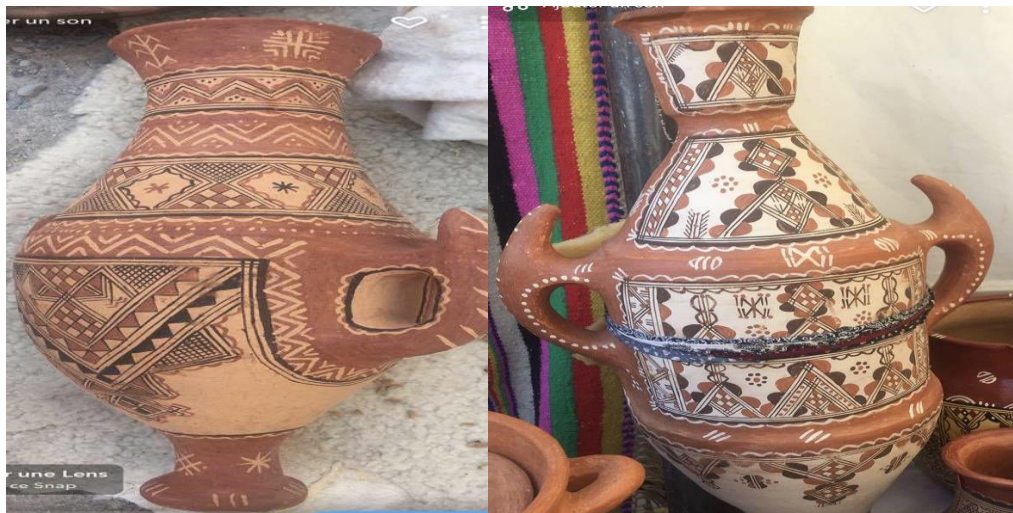
Figure N°21 : Amphore (Tacumuxt)

Une cruche est généralement caractérisée par une forme ovoïde ou ronde avec deux anses sur les côtés pour faciliter le transport. La partie inférieure peut se terminer par une pointe ou un pied étroit qui permet de poser la cruche sans renverser son contenu. Ces caractéristiques ergonomiques facilitent non seulement le transport mais aussi le versement de l'eau.