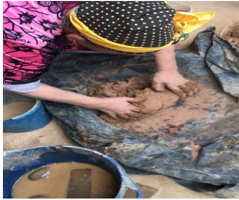
Figure N°05 : Mélanger le moules (afrur) avec l'agile (talayt)