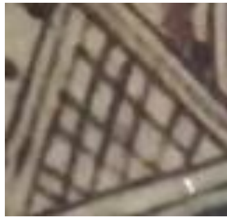
Figure N°30 : Nid d'abeille (ayrum ntzizwa)

Dans la symbolique artisanale, les motifs répétitifs tels que ces petits carrés peuvent également évoquer la régularité et l'ordre dans la vie quotidienne, des aspects importants pour la survie et le bien-être des communautés traditionnelles. Ainsi, en intégrant ce motif, les potiers expriment non seulement leur habileté technique, mais aussi une vision de la vie où travail, patience et douceur mènent à une existence prospère et équilibrée.