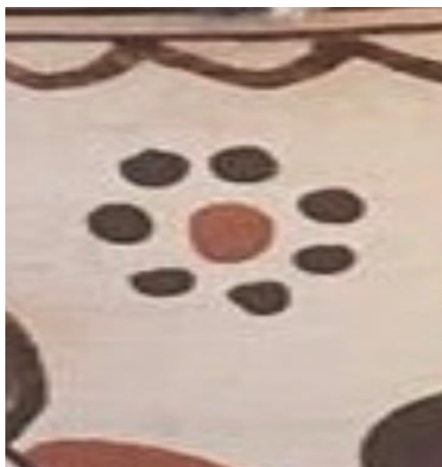
Figure N°31 : Une Assemblée (tajmaçt)

Ce type de décoration rappelle également la transmission des savoirs, où les traditions, comme l'art de la poterie, sont partagées au sein de la famille, garantissant la préservation du patrimoine culturel.