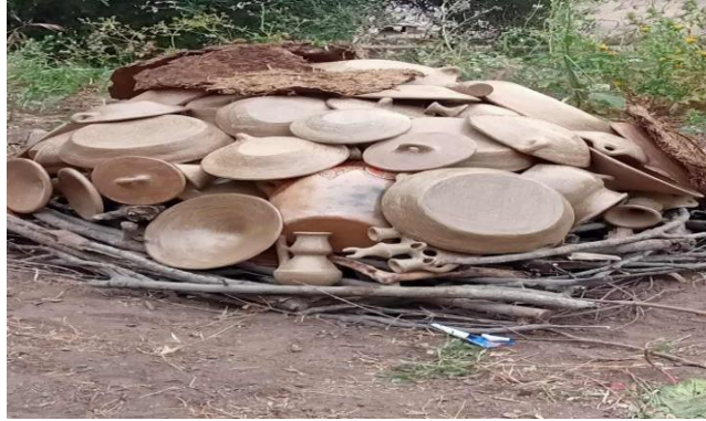
Figure N°09 : Le plat (Tibaqiya)

cuisson, tandis que dans les civilisations antiques, des motifs colorés sont ajoutés après pour créer des contrastes marquants.