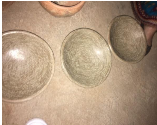
Figure N°13 : Le plat (Tibaqiyyin)

Grâce à son design pratique, il est souvent utilisé lors des repas pour servir des boissons à table, apportant une touche élégante et fonctionnelle à l'expérience culinaire.