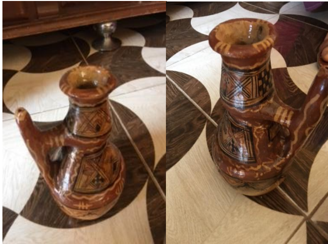
Figure N°16 : Cruches à eau (tibuqalin)

La poterie traditionnelle et rituelle occupe une place importante dans de nombreuses cultures. Elle ne sert pas seulement de fonction utilitaire mais est également imbue de significations culturelles, symboliques et religieuses.