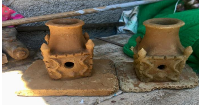
Figure N°20 : Une jarre murale (ikufan)