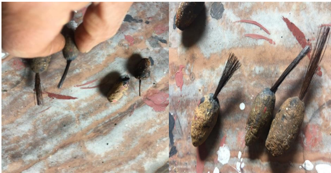
Figure N°23 : les Brosses (timsreqmin)

Les timsreqmin sont ancrés dans la tradition des communautés berbères et sont fabriqués avec des poils de chèvre collés avec de l'argile utilisé dans la tradition des communautés berbères. Ces décorations sont appliquées sur les poteries pour embellir les objets du quotidien comme les jarres, les cruches, les plats, et les bols. Les motifs peuvent également avoir des significations protectrices ou symboliques.