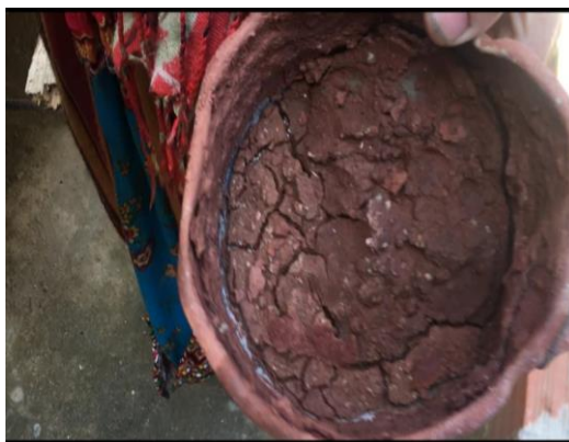
Figure N°26 : ocre rouge (Imuyri)

C'est une terre naturelle composée principalement d'argile et d'oxydes de fer, qui lui confèrent sa couleur rouge caractéristique. Utilisée traditionnellement en Kabylie, notamment dans la poterie artisanale, elle sert à décorer et à protéger les objets en terre cuite. L'ocre rouge est appliquée sur les poteries après leur façonnage, avant ou après la cuisson, pour embellir les surfaces et leur donner un aspect unique