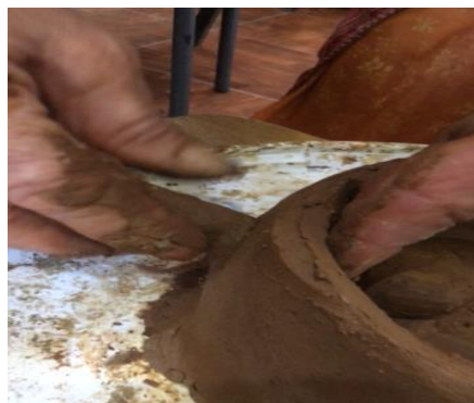
Figure N°07 : Modelage à la Main

Les objets peuvent être façonnés à la main en utilisant des techniques comme le modelage à la plaque.