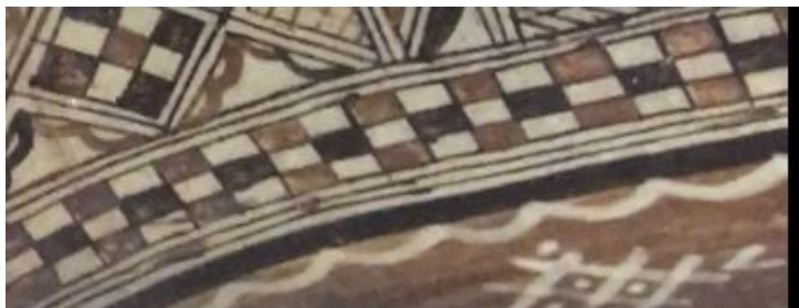
Figure N°29 : Le squelette de serpent (iyesn wezrem)

Ce type de décoration pourrait également être interprété comme un moyen de conjurer le mal ou d'afficher leur résilience face aux défis. Le choix du serpent, avec sa connotation de danger, pourrait aussi refléter une certaine protection spirituelle contre le mauvais présage.