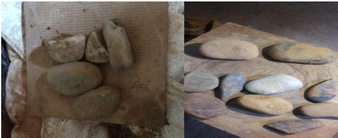
Figure N°24 : Les pierres

b- Après l'Application de l'Engobe : Si un engobe ou une barbotine a été appliqué sur la surface de l'argile, la pierre peut être utilisée pour polir cette couche, la rendant encore plus lisse et brillante.