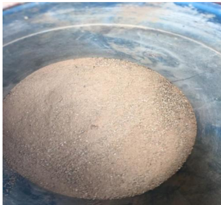
Figure N°06: Moules (Afrur)