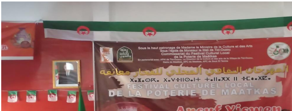
Figure n°02: festival culturel local de la poterie

organisé afin d'encourager les artisans à exposer des produits concurrentiels et de mettre en valeur la poterie de la Kabylie