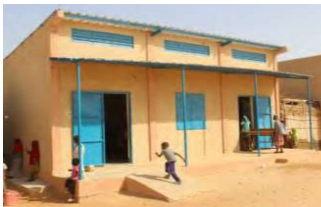
Figure n°03 : classes construites par Plan International Niger