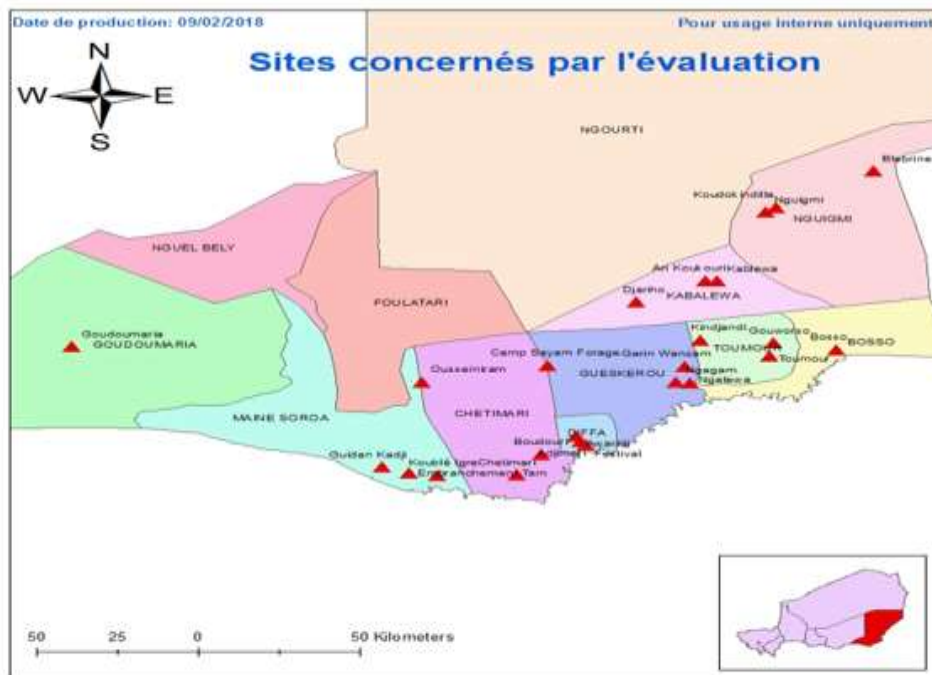
Figure N°01: carte détaillé de la ville de Diffa