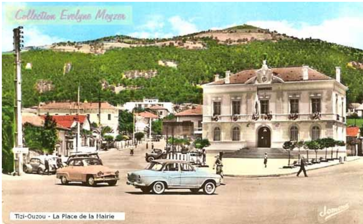
« 1958. L'Hôtel de Ville (Mairie) de Tizi Ouzou, collection de Omar CHEIKH ».

raison de la politique militaire de la terre brûlée appliquée dans les zones de montagnes, les habitants ruraux ont commencé à entreprendre leur exode vers Tizi Ouzou. Ils ont été regroupés dans des cités de recasement telles que la carrière et la cité Mokadem. Le nombre d'habitants est alors passé à environ 15 000 en 1960. De nombreux Tizi-Ouziens ont choisi de rejoindre le maquis, en particulier de nombreux lycéens, s'engageant ainsi dans la lutte armée et sacrifiant leur vie. En 1958, quelques emplois ont été créés à Tizi Ouzou et les premiers HLM (habitations à loyers modérés) ont été construits pour accueillir les ruraux qui affluaient dans la région. Des cités comme Cité Million, Eucalyptus, Les Genêts ont été érigées 114 . Grâce à la guerre, le village colonial a connu sa première transformation majeure.