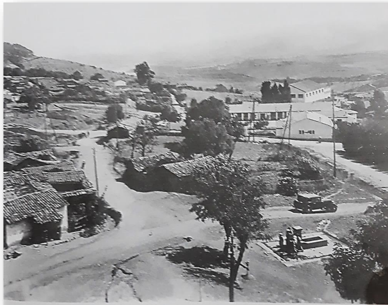
« Le village de Tizi Ouzou – 1900 – Actuelle Haute Ville ; le quartier de Lalla Saida. On aperçoit la fontaine de Ain Si Moh et une voiture descendant de l'actuelle rue Moustefaoui Hocine vers le boulevard Capitaine Mustapha Nouri » 112

population autochtone dont la monétarisation du mode de vie prenait l'ampleur en raison de l'émigration-salarisation » 110 . Effectivement, vers la fin du 19e siècle, l'administrateur de la commune a observé l'émergence des produits d'importation sur le marché de la ville. Cela indique un changement dans le commerce local, avec l'introduction croissante de marchandises provenant de l'extérieur de la région ou du pays. Cette évolution témoigne de l'ouverture de la ville à des échanges commerciaux plus étendus et à une plus grande diversité de produits disponibles pour les habitants, à savoir les « cotonnades, savons, bougies...etc. » 111 .