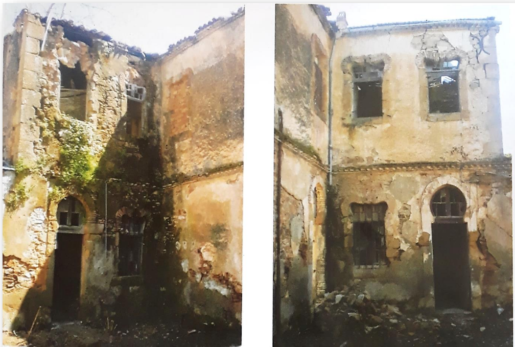
« Tizi Ouzou, la maison des Ait Kaci dans la vallée du Sebaou à l'époque ottomane » 82

SEBAOU, c'est à partir de là que la population a pris de l'ampleur, tous nos frères montagnards qui sont venus travailler la terre ont construit des trucs et ils habitaient là-bas et ils y sont restés. » . C'est avec l'alliance qu'ils ont eu avec leurs voisins arabes qu'ils sont devenus par la suite des Ait Kaci. Les AMRAOUA du haut ont agrandi leur famille à Tamda, ont eu plusieurs progénitures, tandis que les AMRAOUA du bas se sont mutés vers les Ouled Maheiddine. « Après l'invasion française, le départ définitif des turcs de Bordj Sebaou engendra une période d'anarchie où l'exactions, les rapines et les règlements de comptes étaient courants. Les Ouled Maheiddine et tous ceux qui avaient des liens privilégiés avec les turcs avaient désertés la plaine pour se réfugier chez les parents ou amis. » 81 .