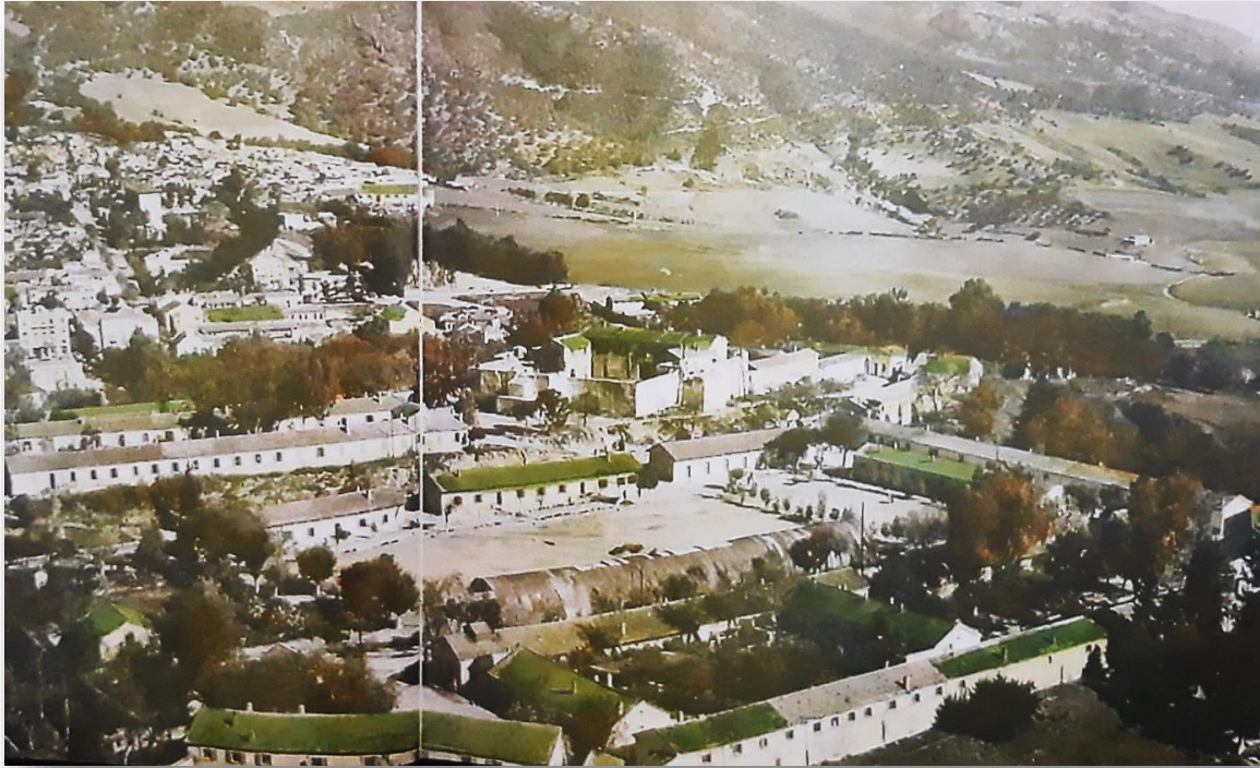
« Tizi Ouzou, 1940, vue aérienne du Bordj Turc transformé en caserne militaire sur la base des vestiges laissés par les Ottomans » 93

Des conflits ont commencé à apparaître dans les tribus kabyles par motif de vengeances des précédents dossiers, notamment les assassinats...etc. C'est ce qui a déclenché un chamboulement et un déséquilibre au niveau de la région, surtout vers l'arrivée des français en 1830. Les ottomans ont essayé de calmer la situation mais ils se sont retrouvé face à des tribus fortes kabyles qui n'avaient pas l'intention de lâcher prise, alors ça s'est terminé par affrontement qui mènera par la suite par la défaite des turcs. Le Bordj Turc se retrouva déserté, abandonné par les siens, ils se sont repliés pour quitter la région et partir vers Alger.