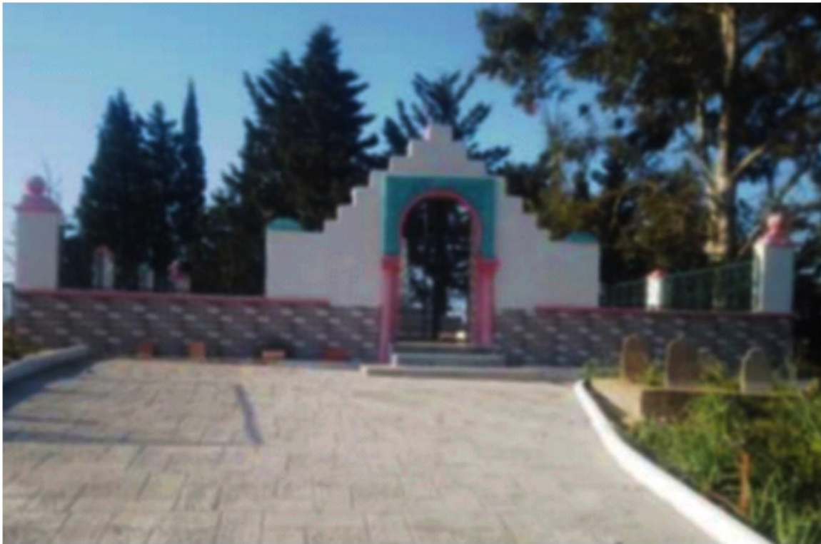
Photo1 : Monument commémoratif des martyrs du village Kalous commune de Frikat.