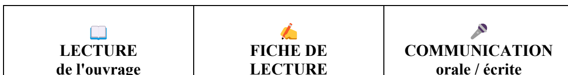
Illustration — Positionnement de la fiche de lecture

En Sciences Financières et Comptabilité, la fiche de lecture s'applique aussi bien aux ouvrages théoriques (finance d'entreprise, comptabilité analytique, audit) qu'aux rapports professionnels, aux normes comptables (IFRS, PCG) et aux articles de revues spécialisées.