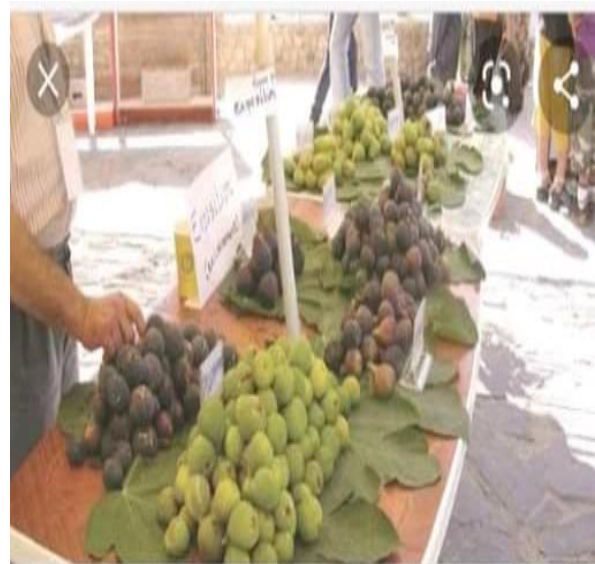
Exposition du figue a chabet el ameur