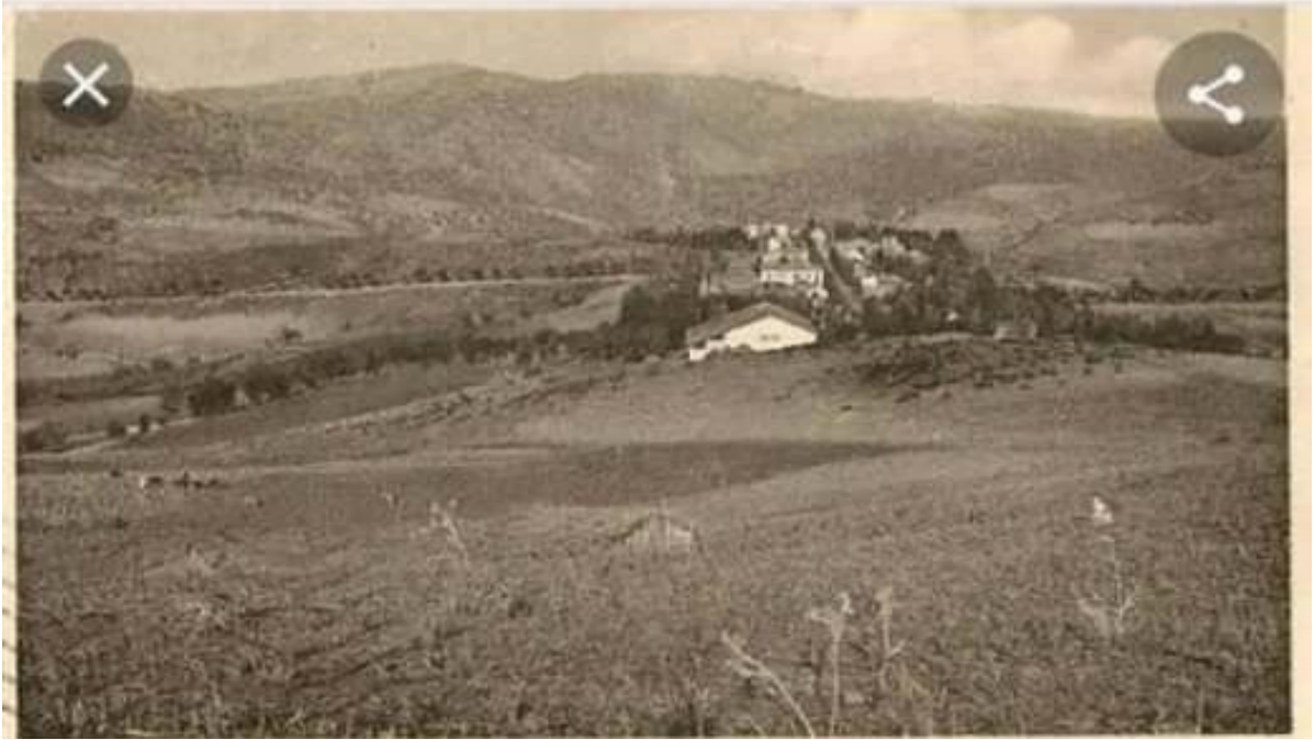
Chabet El Aneur actuellement.