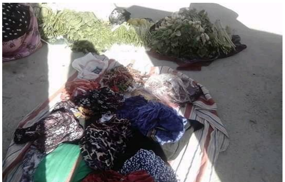
La vente des vêtements