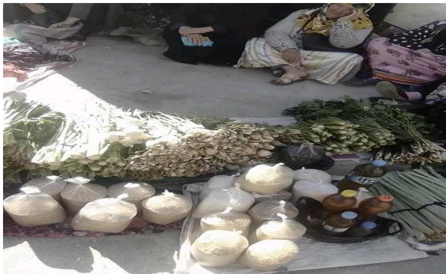
La vente des légumes et l'huile d'olive