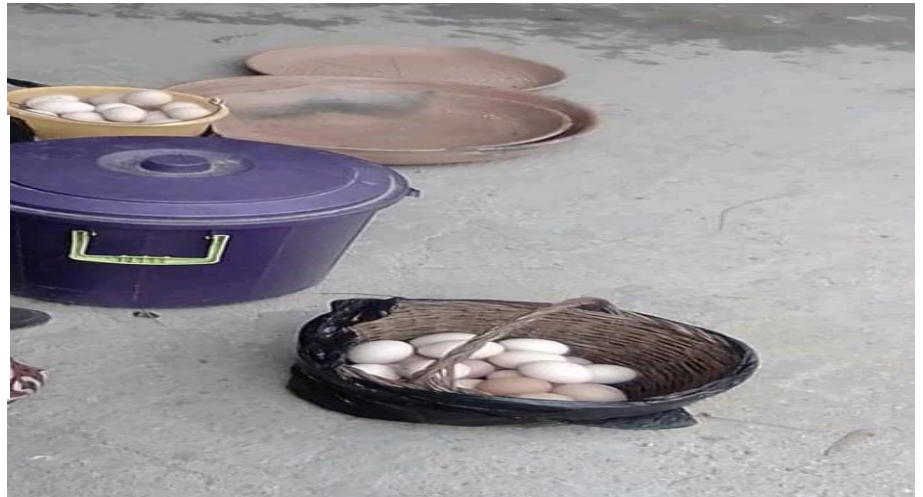
La vente des œufs et la poterie