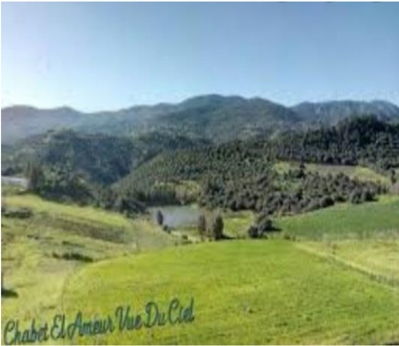
La terre agricoltes a chabet el ameur.