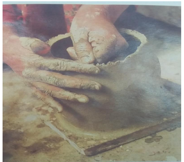
Fabrication de poterie (objets)