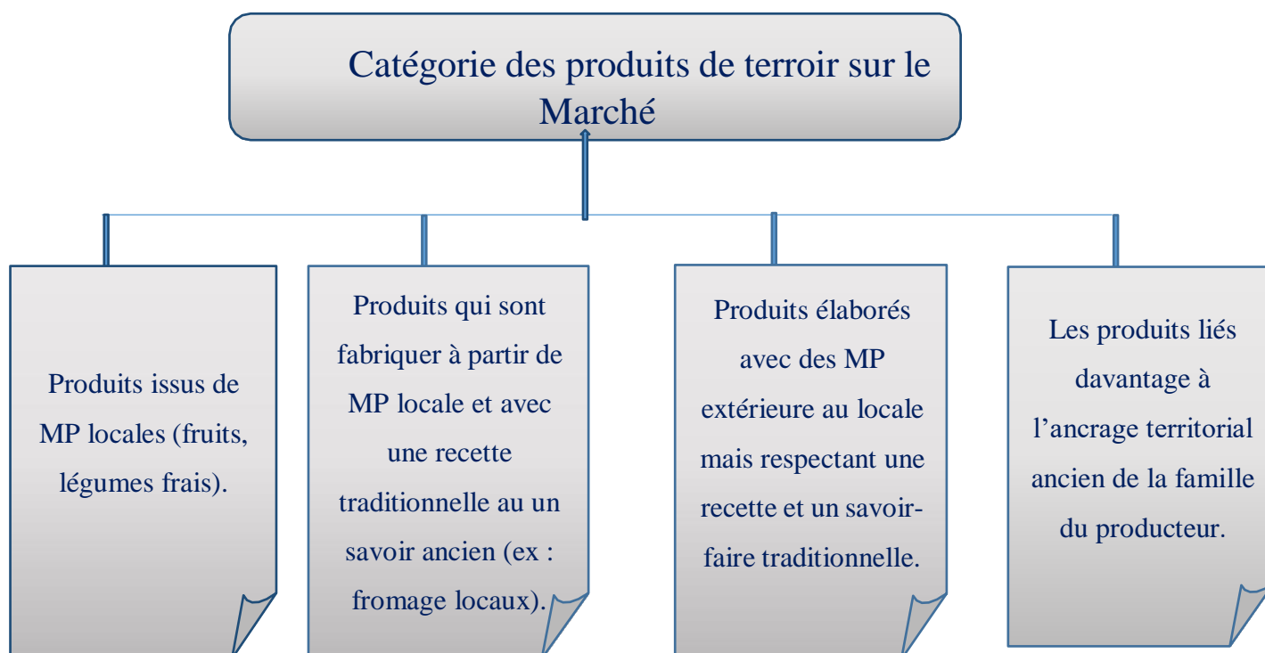
Figure n°02 : classification de produits de terroir sur le marché