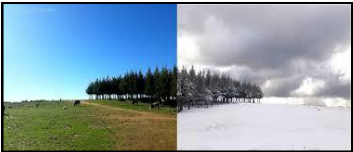
Figure N°04 : Site touristique de Tizi-Oujaaboub, commune de Bounouh.

Tizi-Oujaaboub est un plateau de 118 HA situé à 1200 mètres d'altitude sur les hauteurs de la commune de Bounouh.