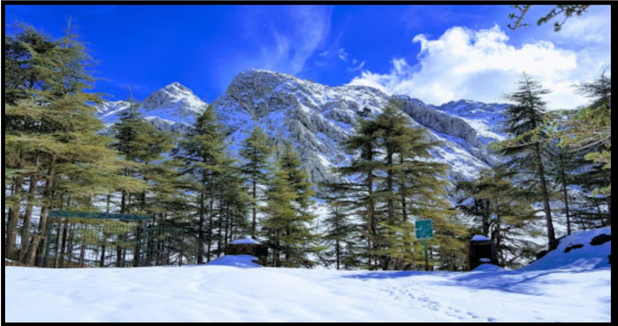
Figure N°02 : Le site touristique Thala Guilef dans la commune de Boghni.