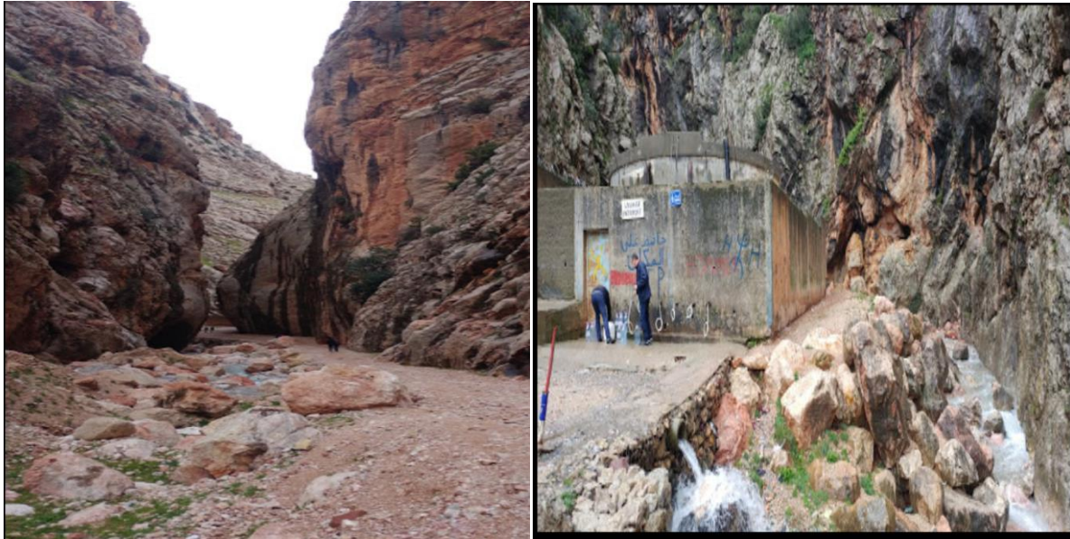
Figure N°05 : Thaburth Laansar dans la commune d'Assi-Youcef

Une fontaine construite par les habitants du village leur sert pour l'alimentation en eau de source. Une multitude de personnes se présentent chaque jour à cet endroit pour en servir et profiter du paysage