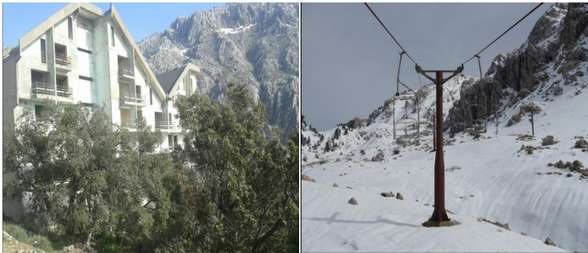
Figure N°03 : Photos de l'hôtel El Arz et la station de ski à Thala Guilef, commune de Boghni.

Ce site est un lieu paradisiaque surtout en période d'hiver et de printemps. La station climatique de Tala Guilef offre dispose d'un télésiège et deux hôtels.