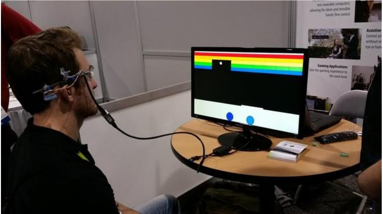
الصورة رقم 4 كمبيوتر خاص بذوي الإعاقة السمعية