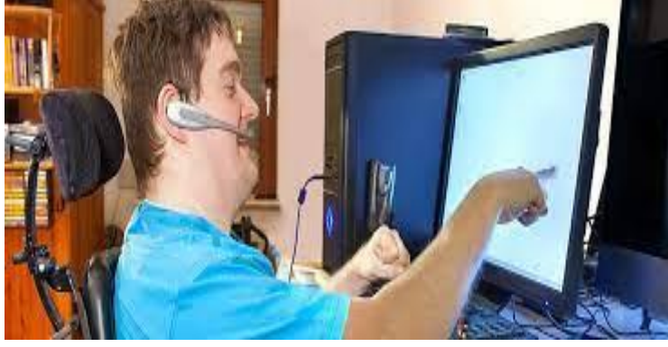
الصورة رقم 03 جهاز الكمبيوتر لناطق