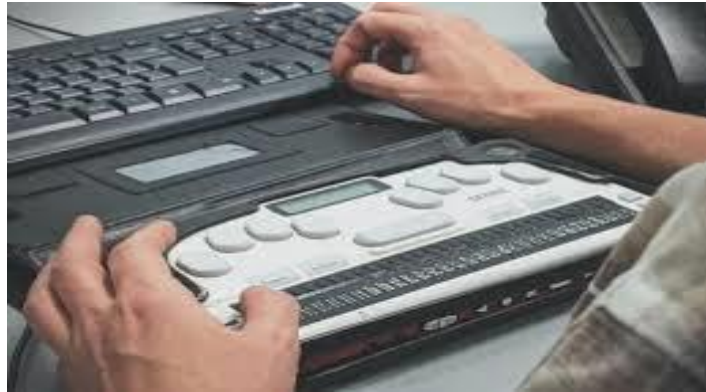
الصورة رقم 02 لوحة مفاتيح برايل