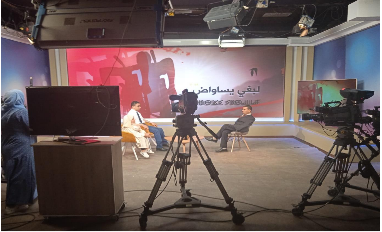
استديو حصة لبغي ايساواض