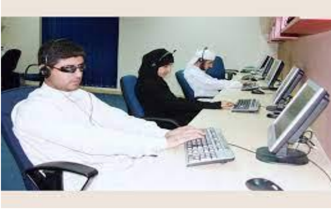
الصورة رقم 05 كمبيوتر خاص بذوي الإعاقة البصرية