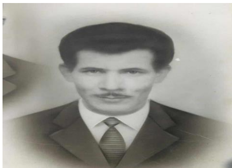
Radi Amar: Né présumé 1937, assassiné par la police Française en 1961 à Paris.