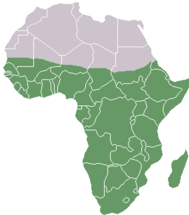
Figure 1 : L'Afrique subsaharienne dans le continent africain

Alors qu'en est-il de l'état de cet ESS en AfSS ?