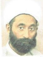
عبد الحميد بن باديس