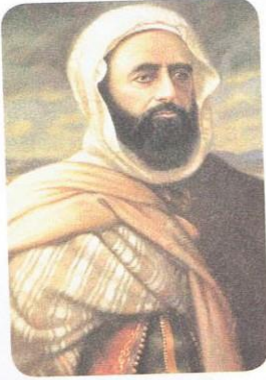
الأمير عبد القادر

□ قُلْ جُملاً على نَفْسِ المِنْتِوَالِ مُسْتَعْمِلًا : قَدْ .