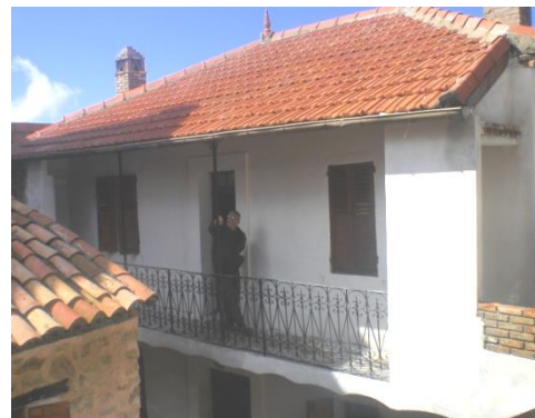
La Maison familiale de Abane Ramdane Classée et restaurée