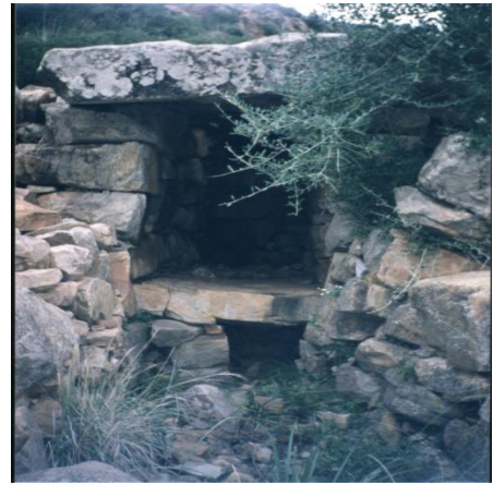
Monuments funéraires (Allées couvertes) Ait RHouna – Azeffoun