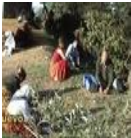
Cueillette des olives