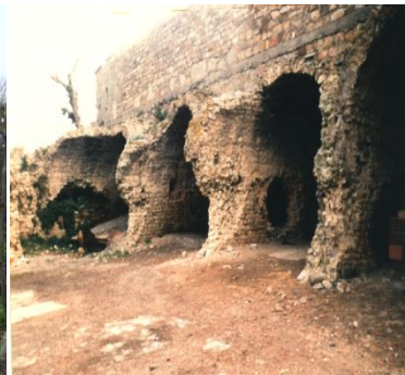
Citernes antiques d'Azeffoun