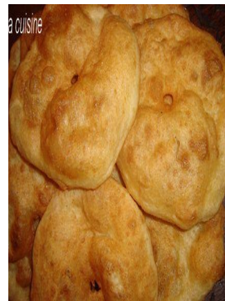
beignets « Sfendj »