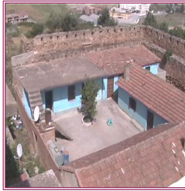
Le bordj turc de Boghni (etat actuel)