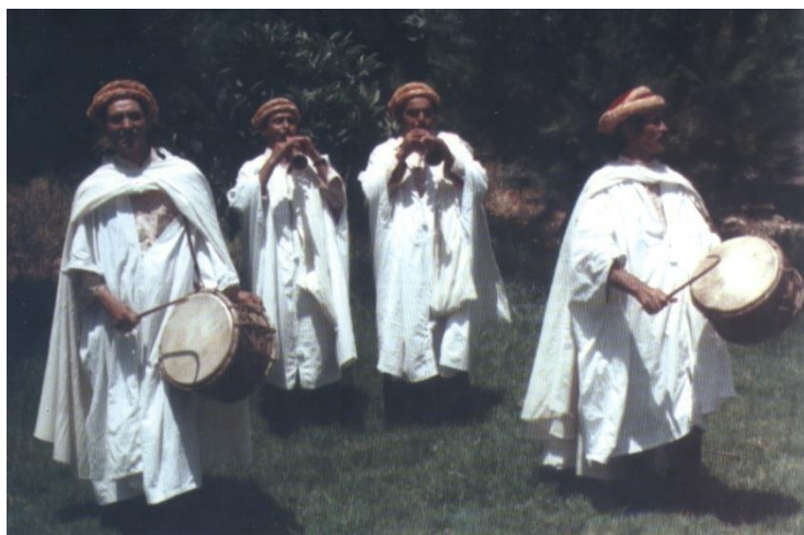
Troupe de la musique Traditionnelle kabyle (idhebbalen)