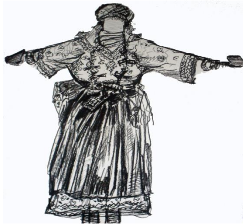
Rite d'Anzar, louche déguisée en femme