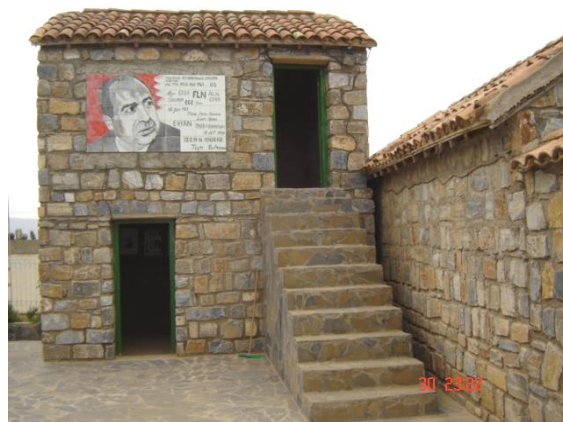
Maison Krim Belkacem