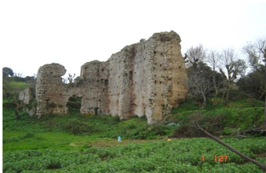
Thermes antiques d'Azeffoun