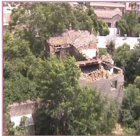
maison des Ath Kaci (état actuel)