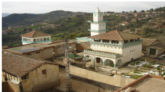
La Zaouïa de Sidi Ali Moussa, Classée patrimoine culturel