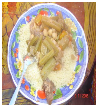
Plat de couscous