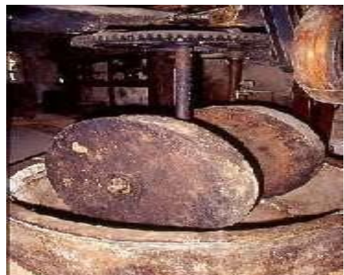
Moulin traditionnel (ancestral)