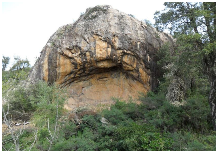
Abris sous roche Ifri N'dlel à Ifigha