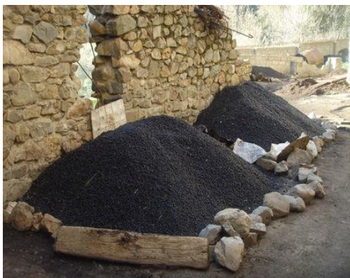
Conservation des olives cueillies