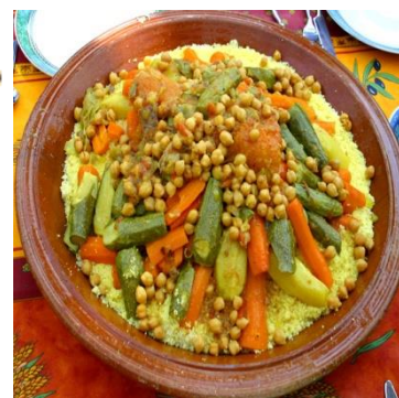
imensi n yennayer