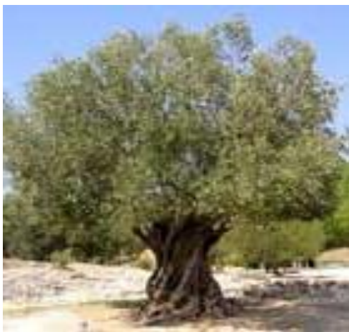
L'olivier plus qu'un arbre...un symbole