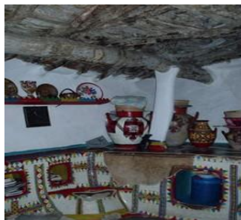
Peinture murale traditionnelle