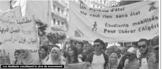
Les étudiants constituent la sève du mouvement

C'est au cœur d'une mobilisation nationale inédite que l'extraordinaire dynamique étudiante a germé. Au fil des semaines, l'appétit des étudiants pour un profond changement de gouvernance s'est fait chaque jour, encore plus vorace. 26 semaines après l'amorce du HIRAK, ils sont toujours là, infatigables, audacieux et déterminés à étancher la soif de liberté de tout un peuple ! Plus encore, ces derniers, se sont constitués en tant que force motrice de tout le mouvement citoyen.