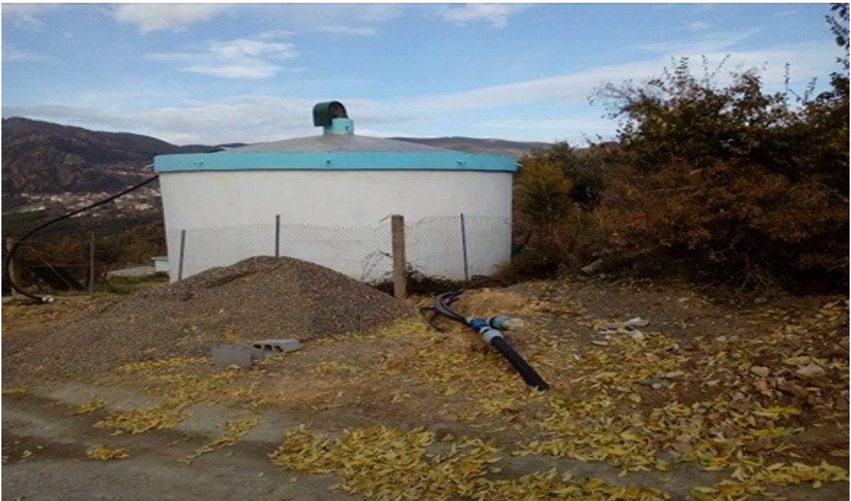
Figure 11 : Château d'eau