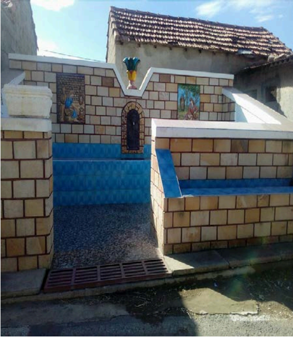
Figure 05 : fontaine non dénommée