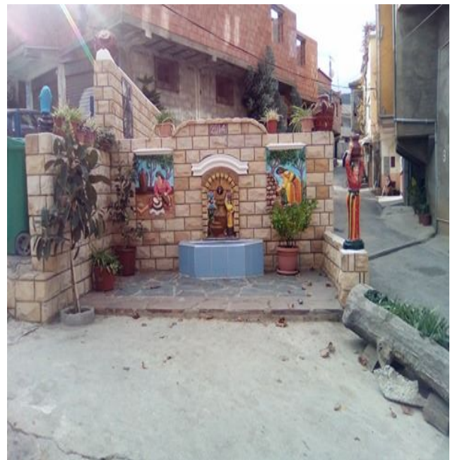
Figure 04 : Fontaine THIKHLIDJT