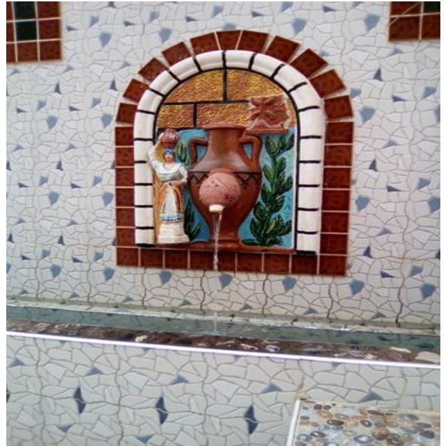
Figure 02 : Fontaine THIZI GUIRES