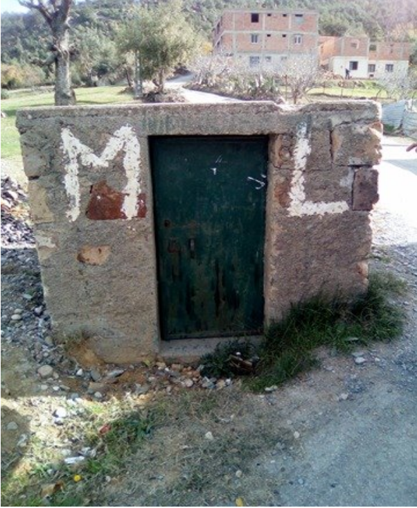
Figure 09 : Première forme de réservoir d'eau