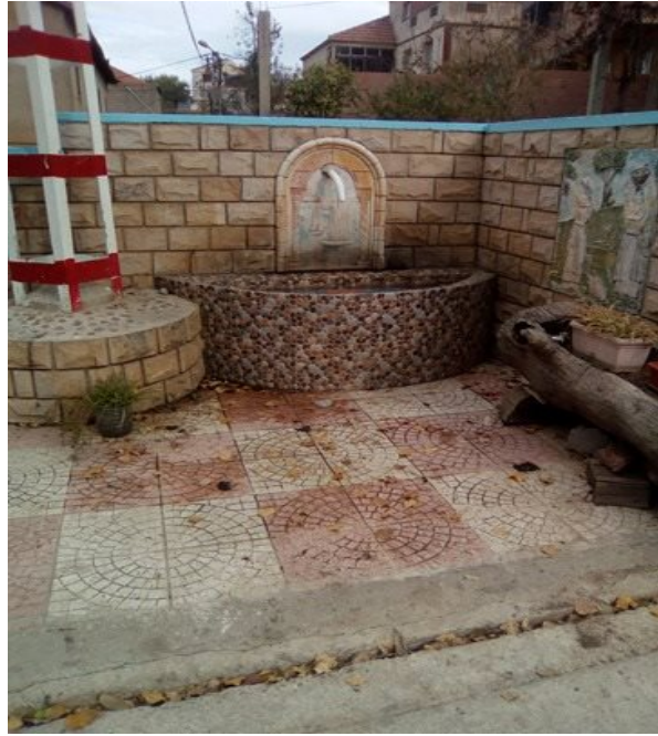
Figure 06 : fontaine non dénommée