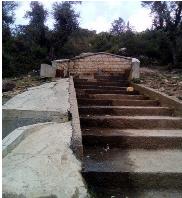
Figure 08 : Fontaine non dénommée