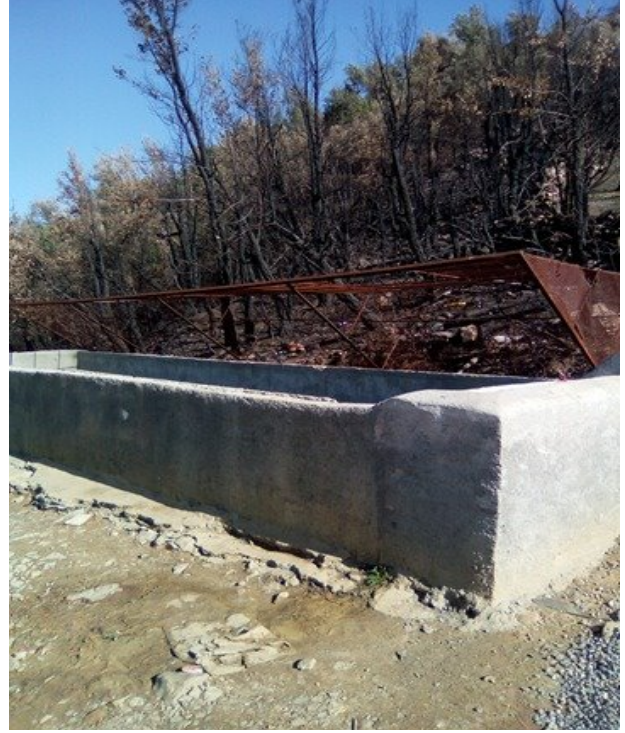
Figure 10 : Bassin d'eau utilisé pour le remplissage des citernes