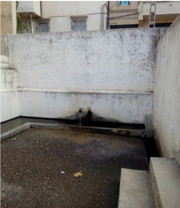
Figure 07 : Fontaine non dénommée