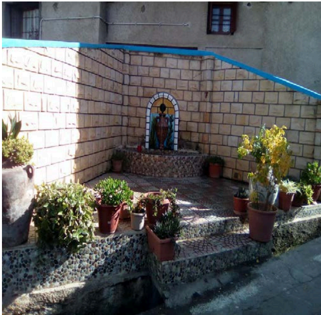
Figure 01 : Fontaine AGWNI