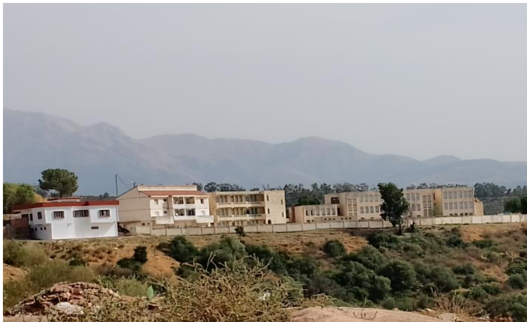
Photo ;08 Établissement moyen au village de Aït Maamar « frère Sadat.

D'après les résultats de* l'école frère Sadat *le pourcentage des filles scolarisés dans les dernières années.