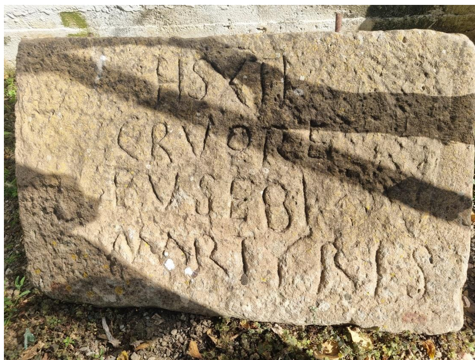
Figure 2 : stèle funéraire.