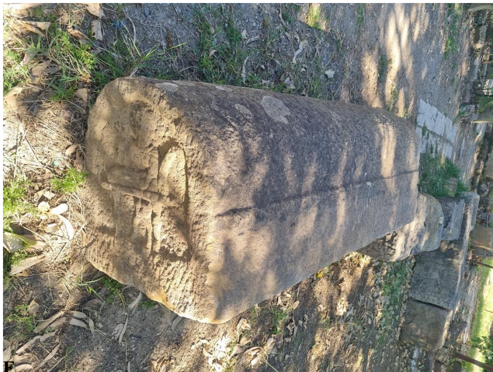
Figure 1 : caisson funéraire .