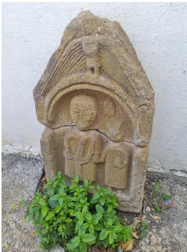
Figure 5 :stèle votive.