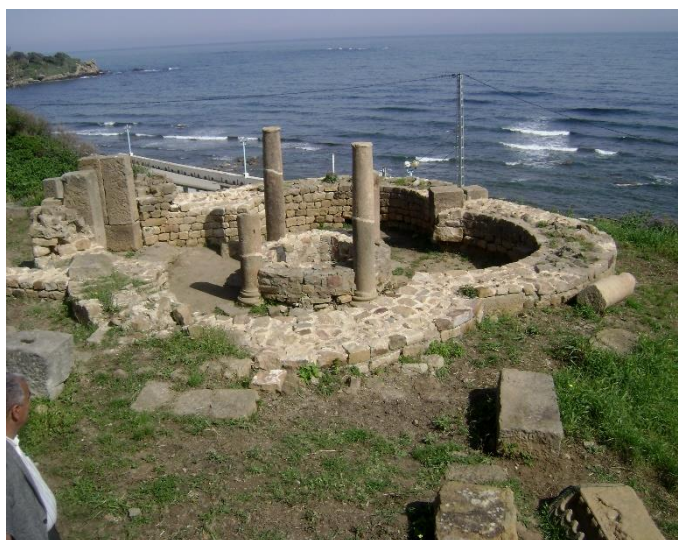
Figure 10 : Le baptistère de la grande basilique .