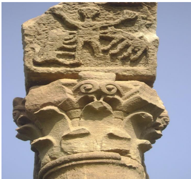
Figure 7 : décore de la grande basilique .