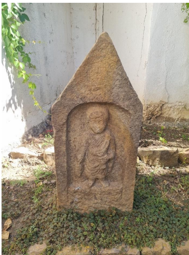
Figure 6 : stèle votive .