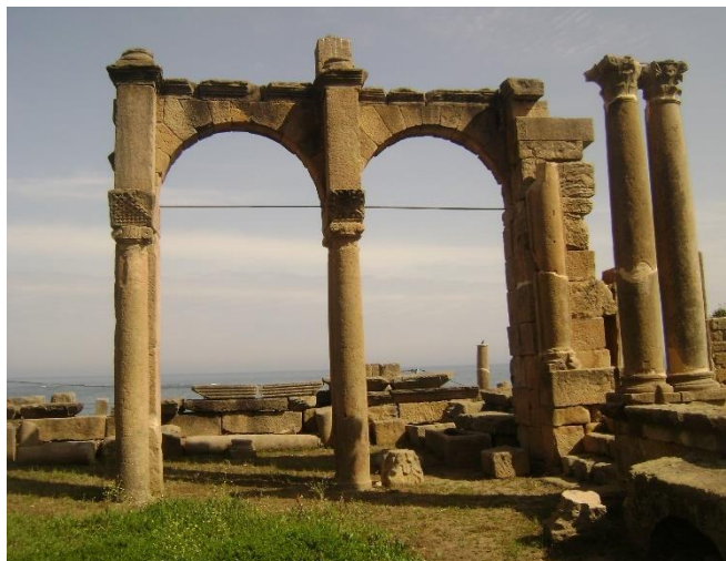
Figure 9 : La nef centrale de la grande basilique de la 6 ème siècle .