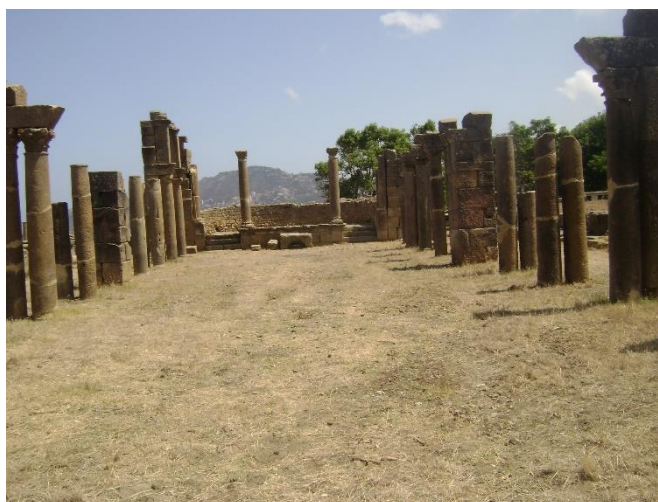
Figure 8 : Les arcades de la grande basilique .