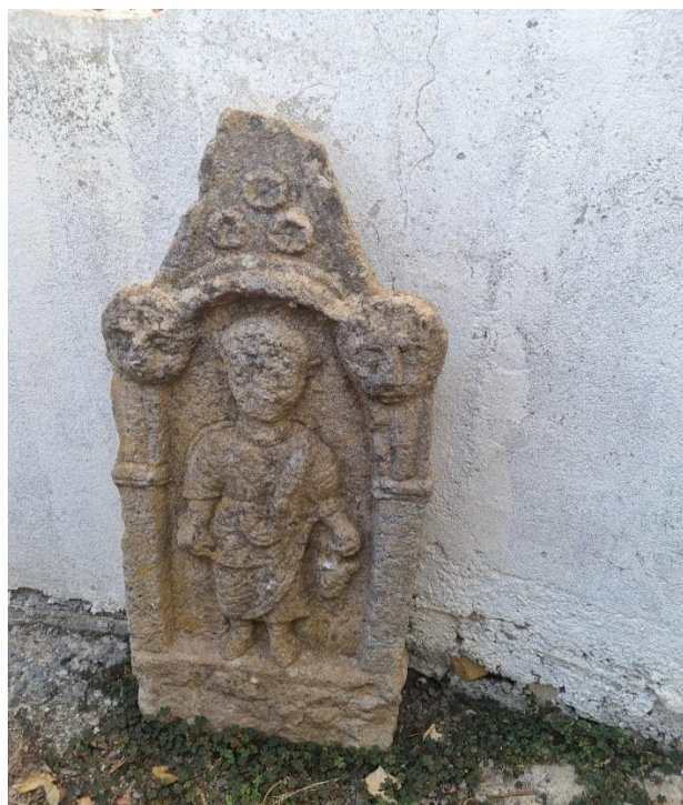
Figure 4 : stèle votive .