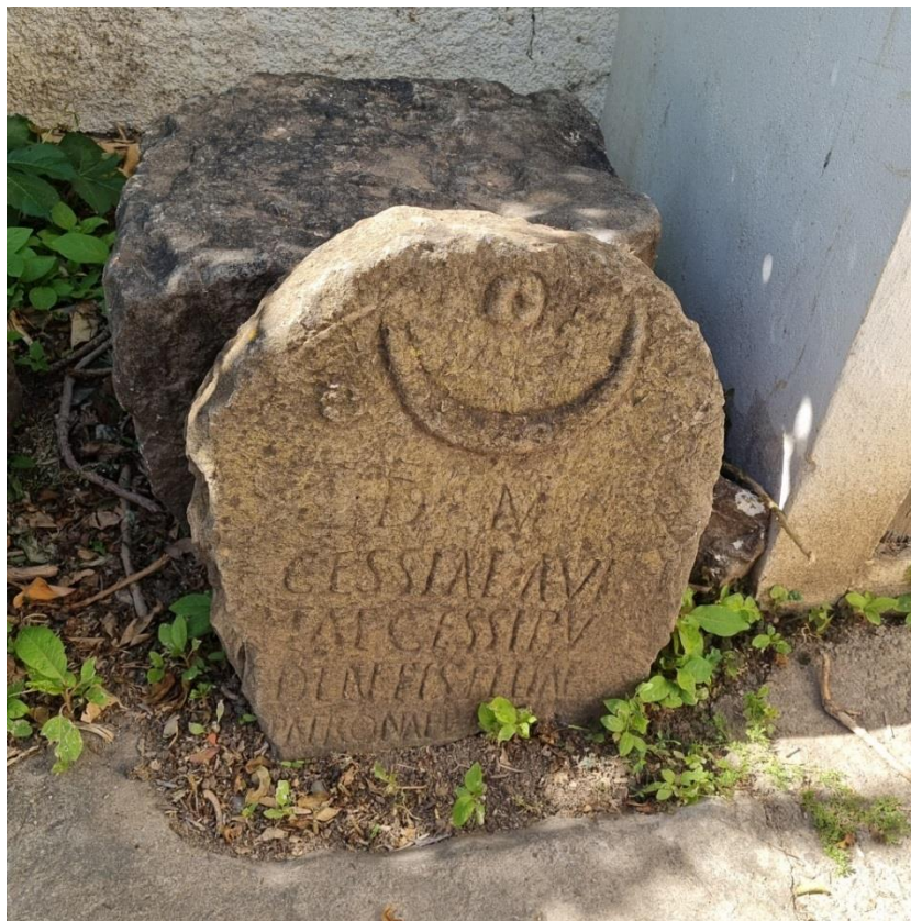
Figure 3 :stèle funéraire .