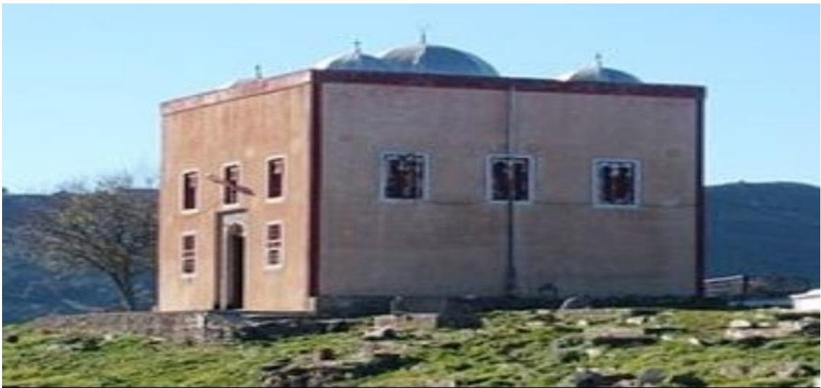
Sidi hend ulefqi