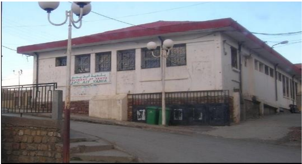
Tayiwant n at yehya