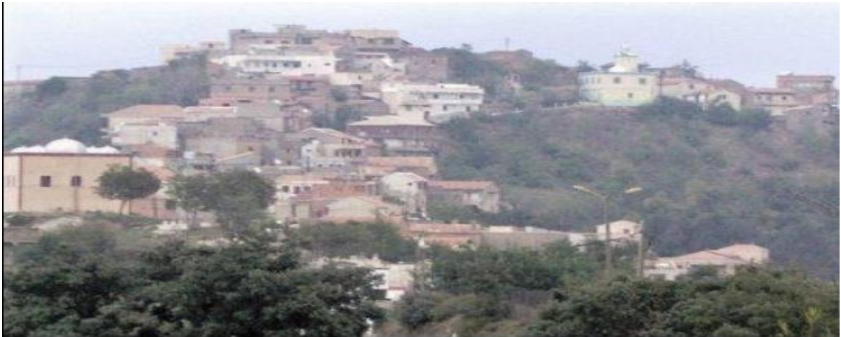
Taqa at yehya