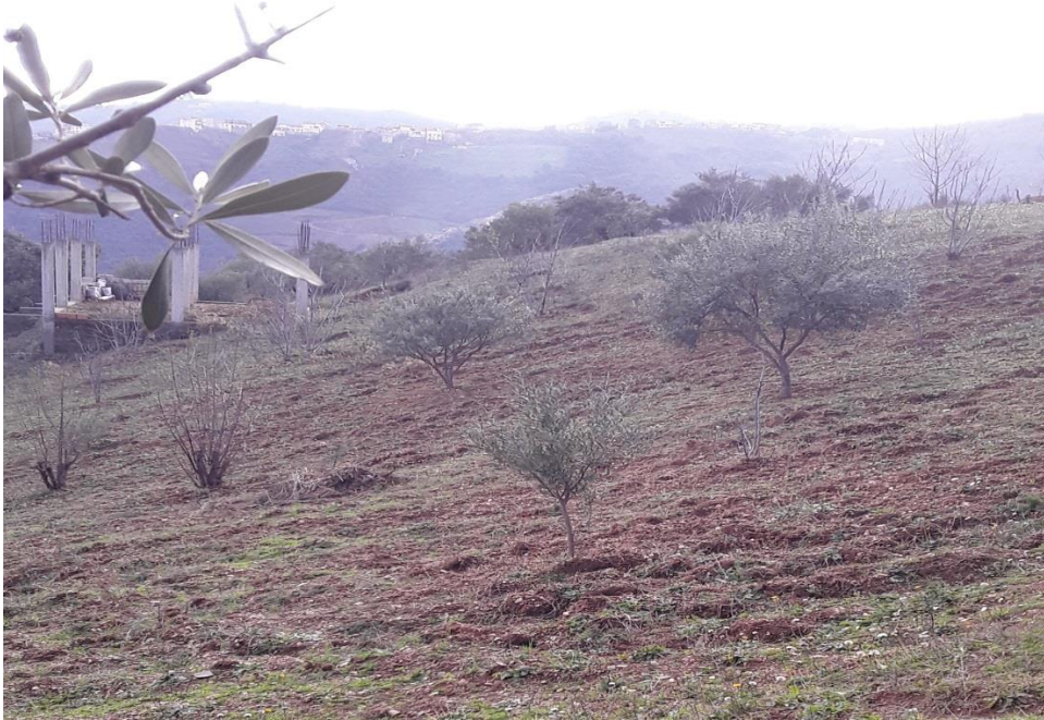
Iyil n yidersan