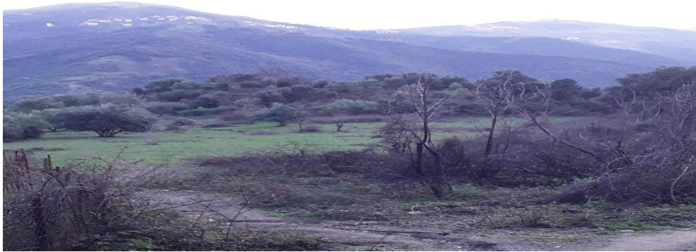
Agni n tfiras