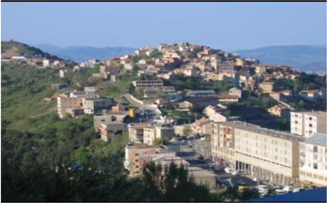
At hicem- Ssebt