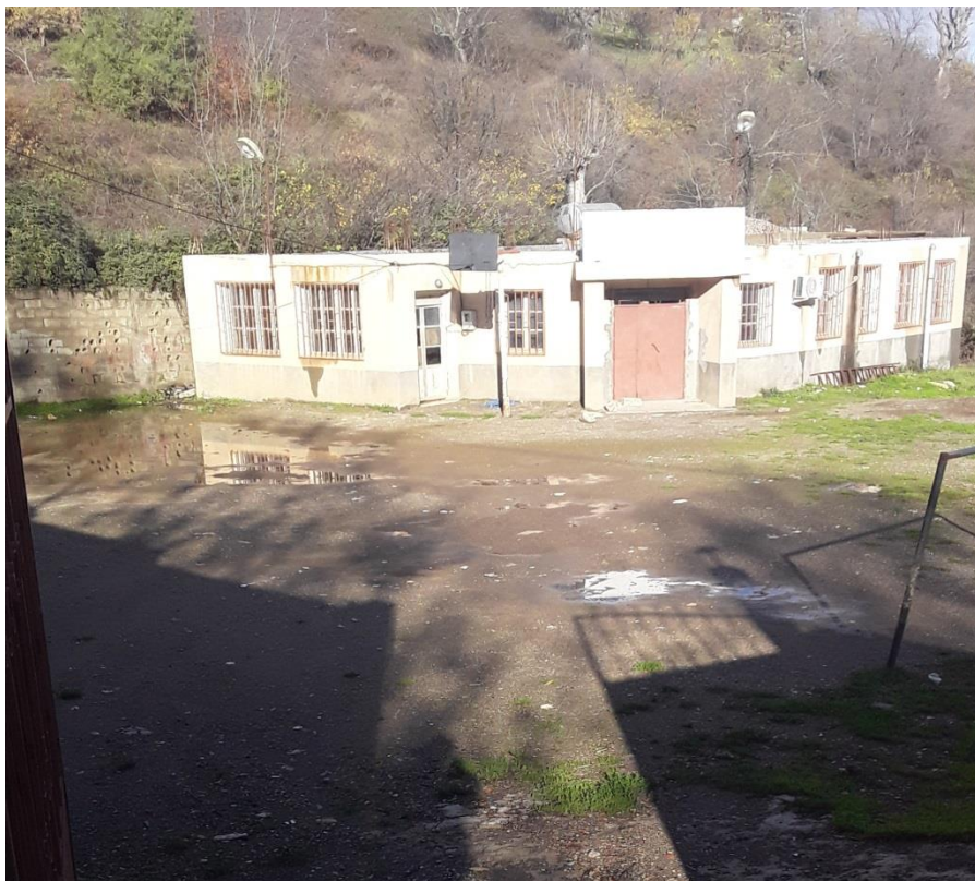
Llakul n tbellit