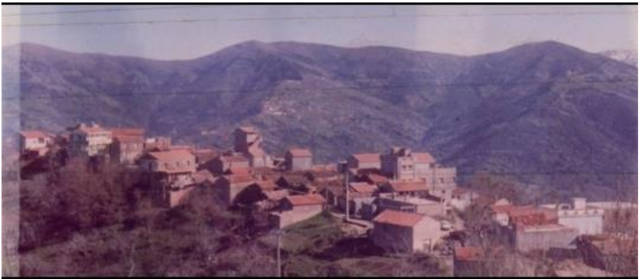
At ziri- At waeli