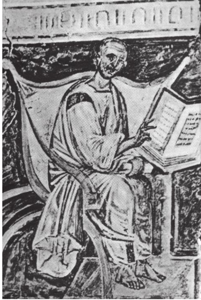
الصورة رقم (01) :

الصورة رقم (01) : أقدم صورة للقديس أوغسطينوس تصوير جصي القرن السادس