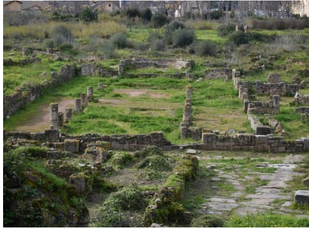
الشكل رقم (01) :