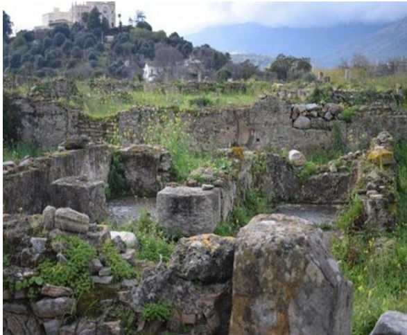
الشكل رقم (03) :