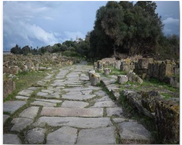
الشكل رقم (02) :

الشكل رقم (01) : مخلفات كنيسة هيبو الشكل رقم (02) : الطريق الرابط بين هيبو و البروقنصولية الشكل رقم (03) : الجزء الخلفي لكنيسة هيبو التي وضعها فارليروس تحت تصرف القديس أوغوسطين