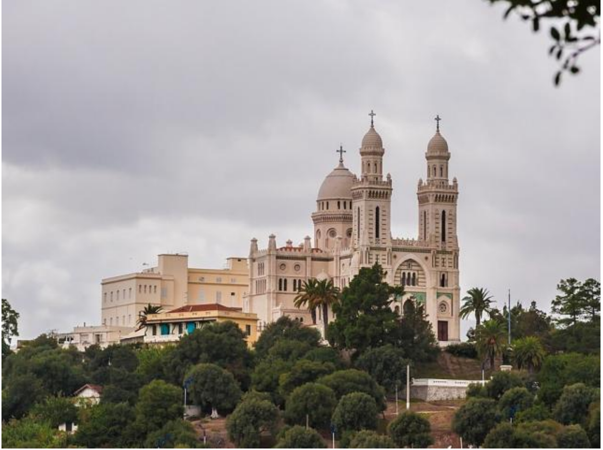
الشكل رقم (04) :

الشكل رقم (04) : كنيسة القديس أوغسطينوس في عنابة بعد الترميم