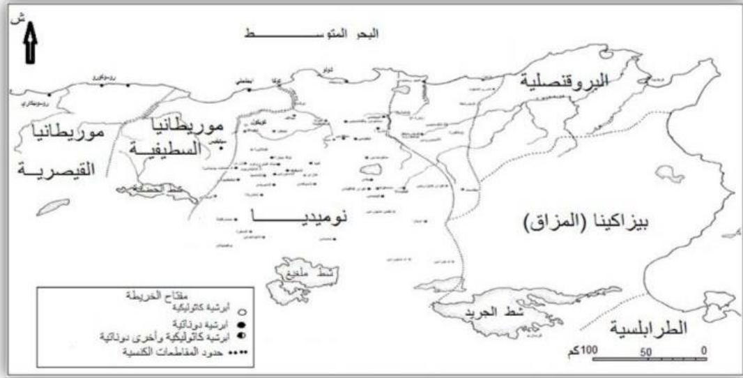
الخريطة رقم 2: