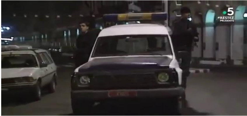
صورة من المقطع 00 : 11 : 50

والذي يعني: "الجزائر تعيش ليلا غير منتهي، اقله عشر سنوات" وكان الصحفي هنا يقصد العشرية الدموية وما حدث من ارهاب في تلك الفترة وميول الصحفي لاختيار مثل هذه اللقطات ما الهدف منها الا تخويف الجزائريين وتحذيرهم من تشابه الاوضاع في الفترة الحالية والاضاع في فترة التسعينات.