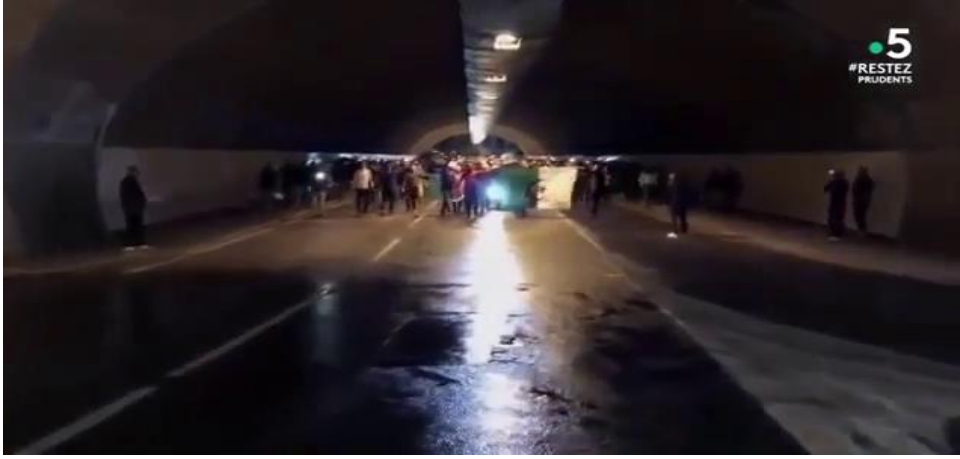
صورة من المقطع 00 :16 :32