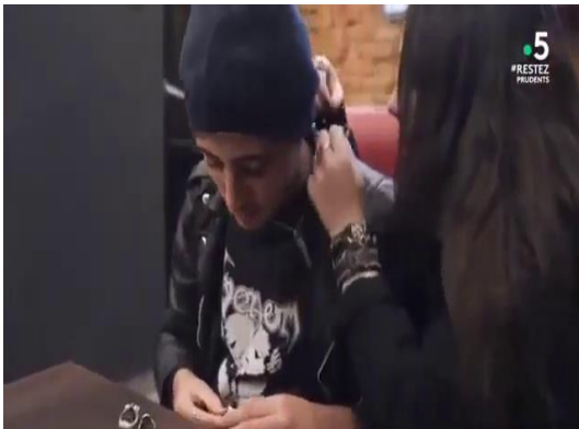
صورة من المقطع 00 :20 :23

وفي لقطة قريبة الى الخصر وبثبات الكاميرا من زاوية عادية يظهر شابين في العشرينيات من العمر، فتاة ذي شعر أسود ولباس أسود تضع على معصمها أسورة جلدية بها جماجم معدنية وتضع أيضا خواتم معدنية على شكل جماجم. وهي تحاول وضع قلادة على عنق الشاب الأخر والذي بدوره يلبس لباس أسود ويضع علاوة سوداء ويحاول وضع خواتم معدنية في أصابعه وهي على شكل جماجم ويظهر أنهما جالسان على أريكة في لقطة توحى بوجود علاقة غرامية بينهما دون وجود حاجز الحياء ولا العادات المعمول بها في الجزائر، ويظهر نوع من التحدي للعقلية والاعراف الجزائرية من طرف الفتاة خاصة اين تحاول الفتاة الظهور بعقلية الفتاة الغربية.