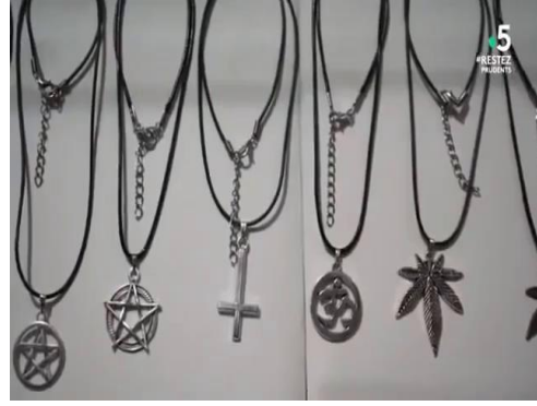
صورة من المقطع 00 :18 :37

وفي لقطة قريبة الى الخصر وبثبات الكاميرا من زاوية عادية يظهر شابين في العشرينيات من العمر، فتاة ذي شعر أسود ولباس أسود تضع على معصمها أسورة جلدية بها جماجم معدنية وتضع أيضا خواتم معدنية على شكل جماجم. وهي تحاول وضع قلادة على عنق الشاب الأخر والذي بدوره يلبس لباس أسود ويضع علاوة سوداء ويحاول وضع خواتم معدنية في أصابعه وهي على شكل جماجم ويظهر أنهما جالسان على أريكة في لقطة توحى بوجود علاقة غرامية بينهما دون وجود حاجز الحياء ولا العادات المعمول بها في الجزائر، ويظهر نوع من التحدي للعقلية والاعراف الجزائرية من طرف الفتاة خاصة اين تحاول الفتاة الظهور بعقلية الفتاة الغربية.