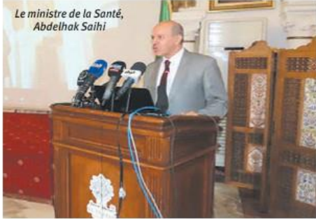
Le ministre de la Santé, Abdelhak Saihi

Le guide d'accompagnement psychologique en faveur des victimes de diverses situations de crises et de catastrophes vient d'être lancé. «Ce guide permettra d'apporter le soutien psychologique nécessaire aux familles des victimes et leurs proches en cas de crises et de catastrophes et cela, grâce aux lignes directrices qu'il contient», a affirmé le ministre de la Santé, Abdelhak Saihi, lors de la réunion, tenue jeudi à l'hôtel El Djazair (ex-St George d'Alger), consacrée à son lancement. «Ce guide constitue un outil accessible et à usage facile, ce qui permettra aux intervenants, à tous les niveaux, de prendre des décisions et d'agir méthodiquement pour une prise en charge optimale des victimes de crises et autres sinistres», a-t-il souligné. Par ailleurs, M. Saihi a fait savoir que l'élaboration de ce