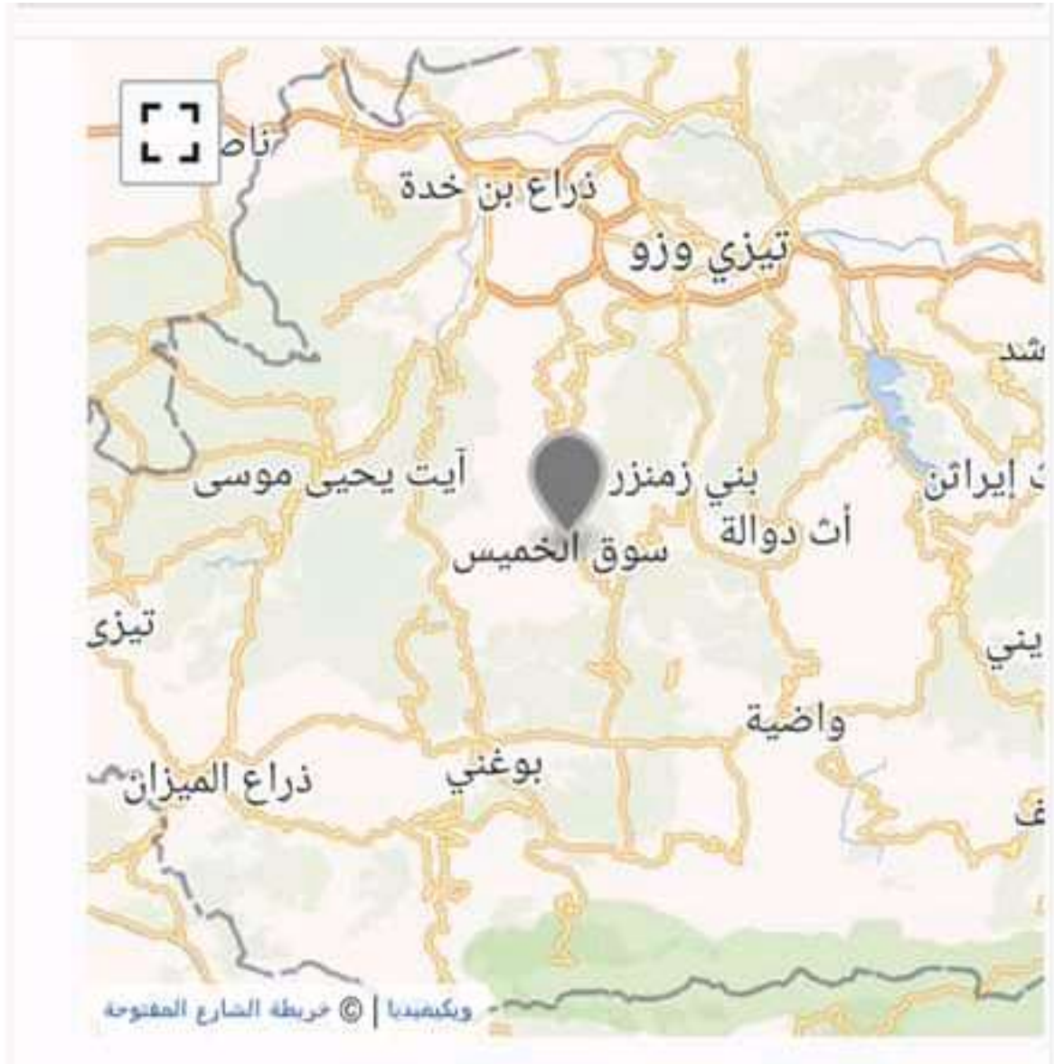
خريطة تمثل موقع دائرة معاتقة