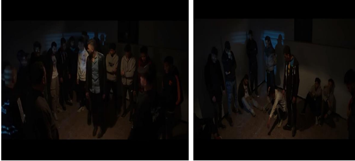
لقطة 01 و 02 من مقطع الحرقاة في قبضة الشرطة واستجوابهم من طرف الضابط

بالواحد." ليرد بيكولا:"هو جاي كحل مبنين و سمين شوية،وقالنا عندي موتور جديد ماعلبليش منين جابه." ليضيف حراق آخر:"واه كيما قالك."