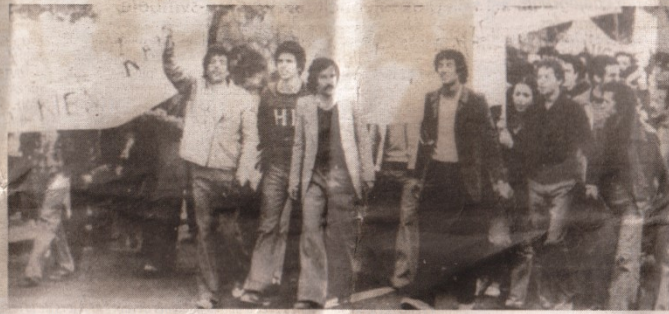
Lors d'une manifestation du Printemps berbère organisée à Alger le 7 avril 1980

Un acte fondateur d'une portée historique intangible. Le Printemps berbère d'avril 1980 marque un moment de rupture globale avec un ordre politique autoritaire adossé à une idéologie factice. A la vision exclusiviste éditée sur le système de parti, de langue, de religion, de culture et de pensée unique de nature violente, Avril 1980 oppose et propose une autre conception de l'Algérie. Un autre modèle de société fondé sur le pluralisme politique, les libertés démocratiques et la diversité culturelle et linguistique. C'est la formulation d'un projet démocratique cohérent précurseur. A contre-courant d'un récit national glorificateur, sacralisant, figé et dogmatique, les thèses d'Avril portent un projet national enraciné dans la réalité historique de l'Algérie et qui est dans le même temps tourné vers un avenir ouvert en résonance avec les aspirations d'émancipation. Et c'est en ce sens que le Printemps d'avril 1980 est permanent. Il inaugure une nouvelle séquence historique impérissable. Partie de Kabylie, cette flamme de liberté ne s'est jamais éteinte. Son onde de choc a débordé les frontières nationales et ne cesse de secouer l'histoire et les mémoires. En libérant des énergies, mobilisant des forces politiques et sociales, elle s'incarne en un mouvement qui se met en marche et qui part à la conquête de ce qui a été véritablement la profondeur civilisationnelle du sous-continent. Face à l'épreuve du temps, mais surtout face aux multiples formes