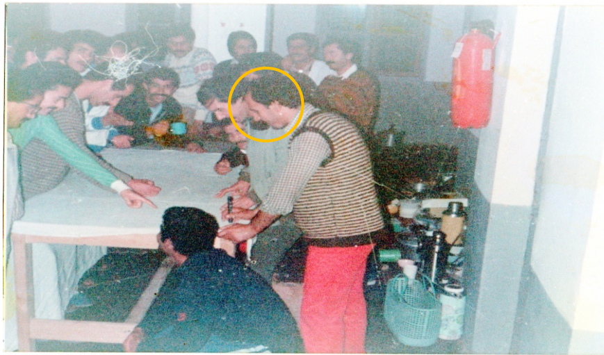
Prison de Berrouaghia, année 1985 : préparation d'une banderole pour la célébration du 1 er novembre 1985 par les membres de la Ligue des Droits de l'Homme et des enfants du Chouhada des associations d'Alger, Tizi-Ouzou et Chlef dans le bâtiment 10, salle 1.