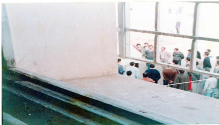
Photo prise d'une fenêtre de l'infirmerie du pénitencier de Berrouaghia, le 1 er novembre 1985 alors que les détenus observent une minute de silence dans la cour de l'établissement.