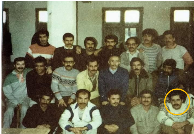
Photo prise avec les militants des Droits de l'Homme et fils de Chouhoda à la salle 1, bloc 10 à Berrouaghia, en novembre 1985.

cette magnifique aventure, mais je me sentais tellement dans mon élément que j'étais prêt à en assumer tous les risques. »